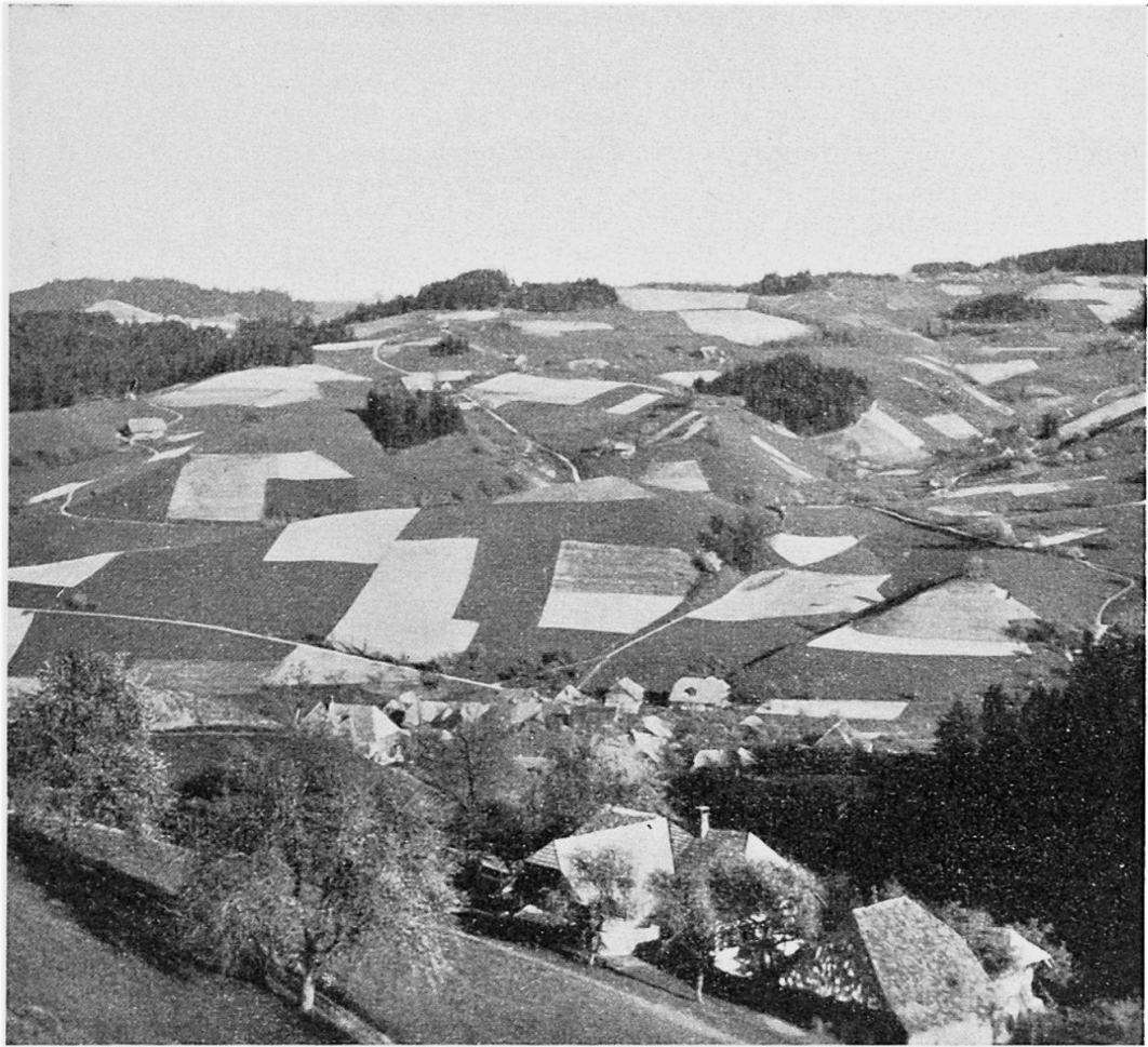
Typische Oberemmentaler Landschaft im Sommer. Blick von der Aspiegg auf Obergoldbach und gegen Ramisberg. Grabensiedlung und Einzelhöfe inmitten ihrer Wiesen- und Ackerfluren (aus: Wanderbuch Emmental II).

platzes, vor der prächtigen Hofstatt eines typischen Emmentalerhauses steht der Uelibrunnen, ein Werk des Bildhauers Huggler mit der überlebensgroßen Gestalt Uelis aus Gotthelfs Werk. An der Straße nach dem Oberdorf begegnen wir links dem schlichten Denkmal GOTTHELFS, einem Werk des Bildhauers Lanz, in einer kleinen erhöhten Anlage von hagebuchenen Hecken umrandet. Kurz nach dem Gasthof zum Ochsen, einem baulich schönen Landgasthof, zweigen wir durch die Straße rechts ab zur Mühle hinunter, steigen wieder links hinauf zum Rand der Talterrasse, von der man einen schönen Überblick auf das Tal der mittleren Emme und der Grüne gewinnt. Von hier sind die Kirchen von Lützelflüh, Sumiswald, Trachselwald und Rüderswil sichtbar. Man überschreitet die landwirtschaftliche Prachtsebene von Waldhaus, wo die schönsten Bauernwesen des Emmentales am Rande der Terrasse liegen, steigt am Galgeli vorbei nach Ramsei hinunter, wo in einem grünen Tälchen die großen Gebäude der Emmentalischen Obstweingensenschaft liegen. Die Straße querend erreichen wir in raschem Anstieg die Höhe des Ramseiberges und des Spinners, wo nachweisbar während sechs Generationen gesponnen worden ist.