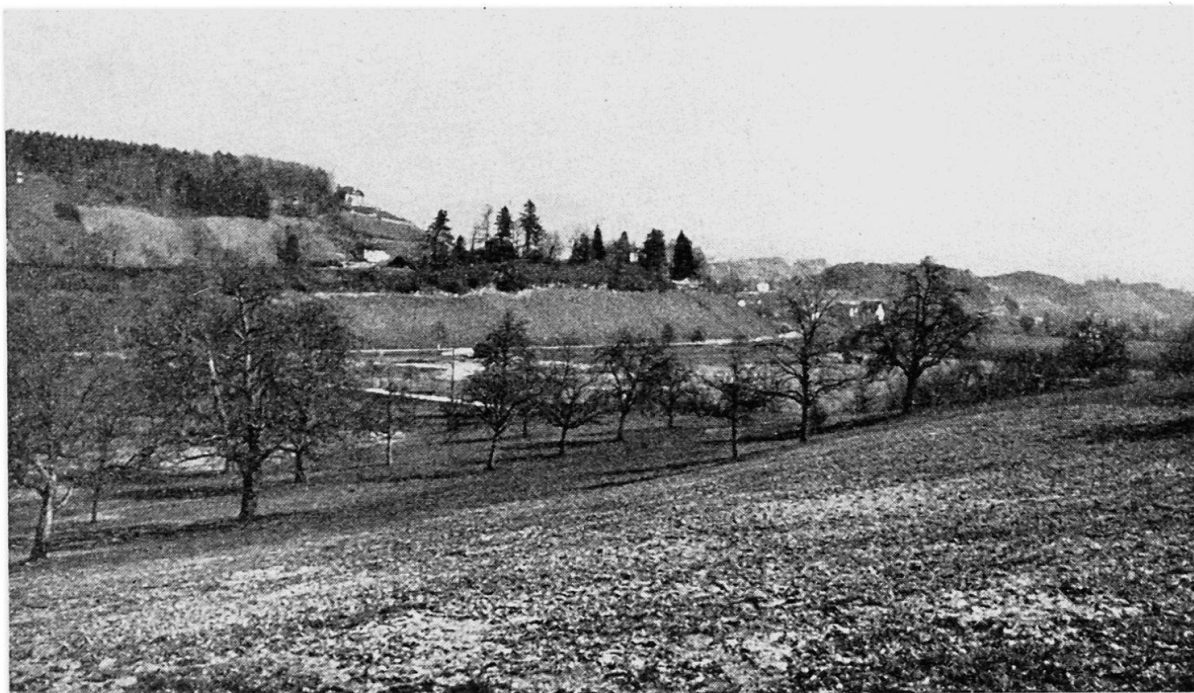
Abb. 1 Nagelfluhschichtterrassen bei Feldbach. Vordergrund: Schirmensee. Mittelgrund: Östliches Ende der zwei km langen Schichtterrasse, auf der die Bahnlinie von Uerikon nach Feldbach verläuft.

Verlauf der Gletscherunterfläche, das fließende Eis ausgedehnte Schichtterrassen herausmodelliert, daß aber dort, wo dies nicht der Fall ist, der Gletscher sich nicht stark um den Schichtverlauf kümmert, es vielleicht zur Ausbildung einer Schichtrippenlandschaft mit gerundeten Formen kommt und bei allzugroßen Abweichungen das Eis sich gänzlich unbekümmert um hart und weich seinen Weg bahnt.