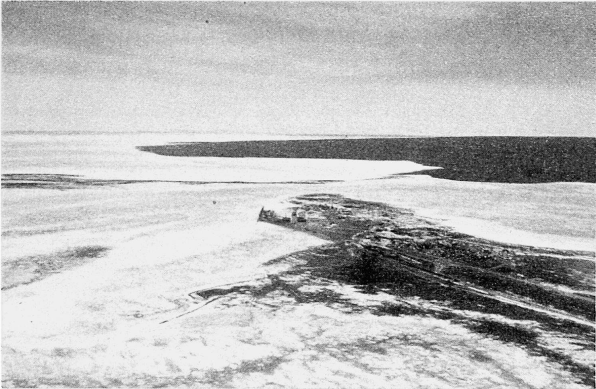
Flugaufnahme von Churchill, Blick nach NW. Links vorne der zugefrorene Churchill River. In der Bildmitte Hafenmole und Silo, rechts die Ortschaft und Bahnlinie. Längs der Küste ist das Meer noch gefroren. Photo A. HUBER, 1. Mai 1951

Diese seichte Meeresbucht wird hufeisenartig von dem mächtigen präkambrischen Kanadischen Schild umfaßt, der als öde, menschenleere Hügel-, Seen- und Waldlandschaft die bevölkerten Teile von Kanada nach N abschließt. Die Gegend lag während der Glazialperioden unter einer dicken Eiskappe und hebt sich seit dem Zurückweichen der Vergletscherung deutlich. Wie eingemauerte Haken an den Felsen in der Mündung des Churchill River, an denen Expeditionen des 18. Jahrhunderts ihre Schiffe befestigten, erkennen lassen, stieg das Land in zwei Jahrhunderten um mehr als zwei Meter an.