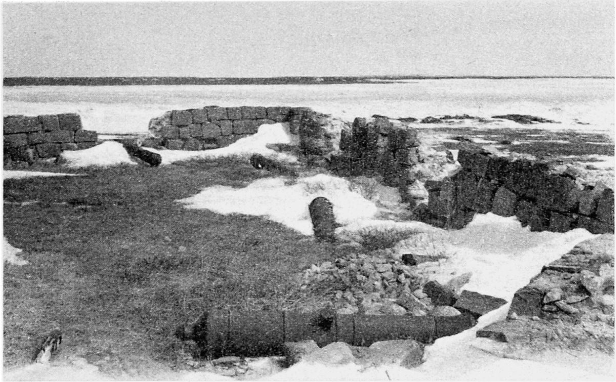
Fort Prince of Wales, Churchill. Bis auf einen kürzlich restaurierten Teil blieb die Ruine so erhalten: wie sie die Zerstörer 1782 zurückgelassen hatten. Hinten W-Ufer der Hudson Bay. Photo A. HUBER, 3. Mai 1951

dischen Mittleren Westens als zukünftige Kornkammer immer mehr erkannt wurde und Siedler aus Europa in mühseligen Reisen von der kanadischen E-Küste aus nach W zogen, erschien es als naheliegend, die Hudson Bay als Eingangsweg zu wählen. Tatsächlich kamen schon in den Jahren 1811—1813 mehrere Schübe schottischer Auswanderer, ausgesandt von dem Kolonistenpionier Lord SELKIRK, um via Hudson Bay das Gebiet des Red River, in der Umgebung des heutigen Winnipeg, zu erreichen. Sie folgten dabei dem Lauf des Nelson River, der ca. 300 km s von Churchill in die Bucht mündet, aufwärts. In den frühen Stadien der Kolonisierung Kanadas erwies sich Churchill als Eingangstor ungeeignet, weil der Churchill River nicht nach den fruchtbaren Präriegebieten im S führt, sondern seinen Ursprung in den unwirtlichen Waldgebieten im W der Bucht hat. Eine einzige Kolonistengruppe wurde, vermutlich irrtümlich, im Jahr 1813 an der Mündung des Churchill River abgesetzt, von wo sie sich der Küste entlang zum Nelson River durchschlug.