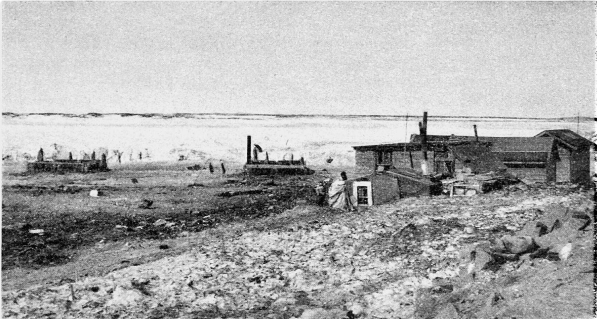
Hütten von Eingeborenen beim Hafen von Churchill. Links davon zwei Brettverschläge für die Schlittenhunde. Dahinter der zugefrorene Churchill River. 2. Mai 1951

Aus verständlichen Gründen stehen keine genauen Unterlagen über das heutige militärische Churchill zur Verfügung. Das Camp, 8 km landeinwärts vom Hafen gelegen, ist eine moderne städtische Siedlung mit allem Komfort, Spital, Schulen, Ein- und Mehrfamilienhäusern usw., die rund 5000 Personen, militärische Angestellte und ihre Familien, beherbergt. Sie ist Außenstehenden zwar verschlossen, doch arbeiten verschiedene Einwohner des zivilen Churchill dort, und die Bedürfnisse einer derart großen Siedlung bedeuten auch für das zivile Churchill, die Bahn, den Hafen, die Geschäftsleute, vermehrten Verdienst.