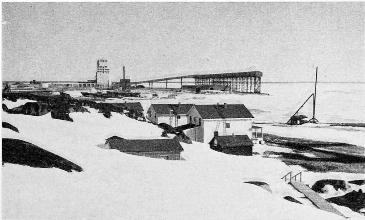
Blick auf den Hafen von Churchill, in Richtung SE. Links der Silo, rechts davon Mole und Anlagen für die Getreideverladung (Fließbänder und Röhren). Im Vordergrund Notspital, nur im Sommer geöffnet. 1. Mai 1951

leute und Hafearbeiter, die vor allem von einigen großen Schiffahrtsgesellschaften in Montreal gestellt werden, und für drei Monate leben 1500 geschäftigte Menschen in der kleinen Ortschaft. Mit dem Weggang des letzten Schiffes Mitte Oktober verläßt der größere Teil von ihnen Churchill wieder, während ein Stock von rund 500 dauernden Einwohnern zurückbleibt. Zu ihnen gehören z. B. die Angestellten der Bahn und das Personal der Generatorenanlage und der Trinkwasserversorgung. Churchill bildet, was zentrale Dienste anbetrifft, trotz seiner Kleinheit eine sehr vollständige Einheit. Es besitzt neben den schon genannten Einrichtungen eine Bank, ein Postbüro, eine Radiostation, einen gut dotierten Polizeiposten, eine Schule, zwei Kirchen (katholisch und anglikanisch), eine katholische Mission, zwei Hotels, einen HBC-Posten, ein weiteres Kaufhaus, zwei Restaurants. Spital und Arzt stehen in dem etwa 6 km weit entfernten Militär-Camp zur Verfügung.