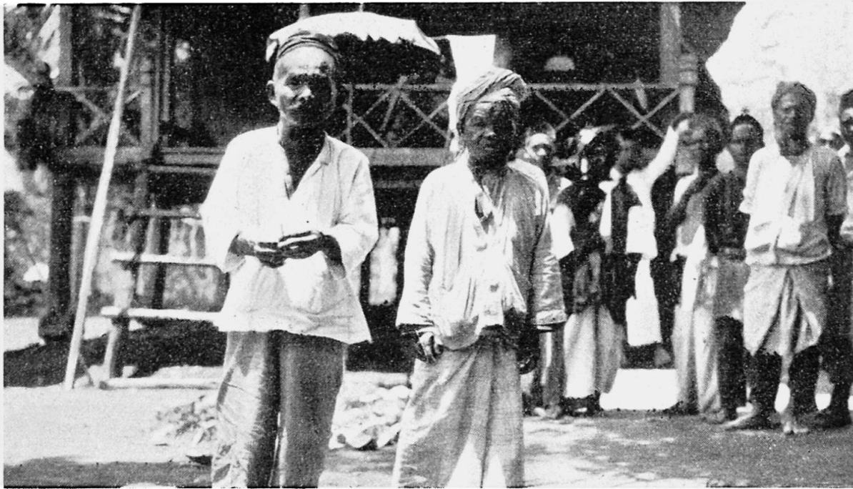
Nains d'un village Batak de l'arrière-pays d'Asahan.

on traçait un cercle et enfonçait un pieu dans la terre. La terre provenant du trou était semée sur le pourtour du cercle. Un coq, lié avec une patte au pieu, était sacrifié et on lui demandait de montrer avant de mourir l'endroit du nouveau village. La place où l'animal mourait indiquait cette direction.