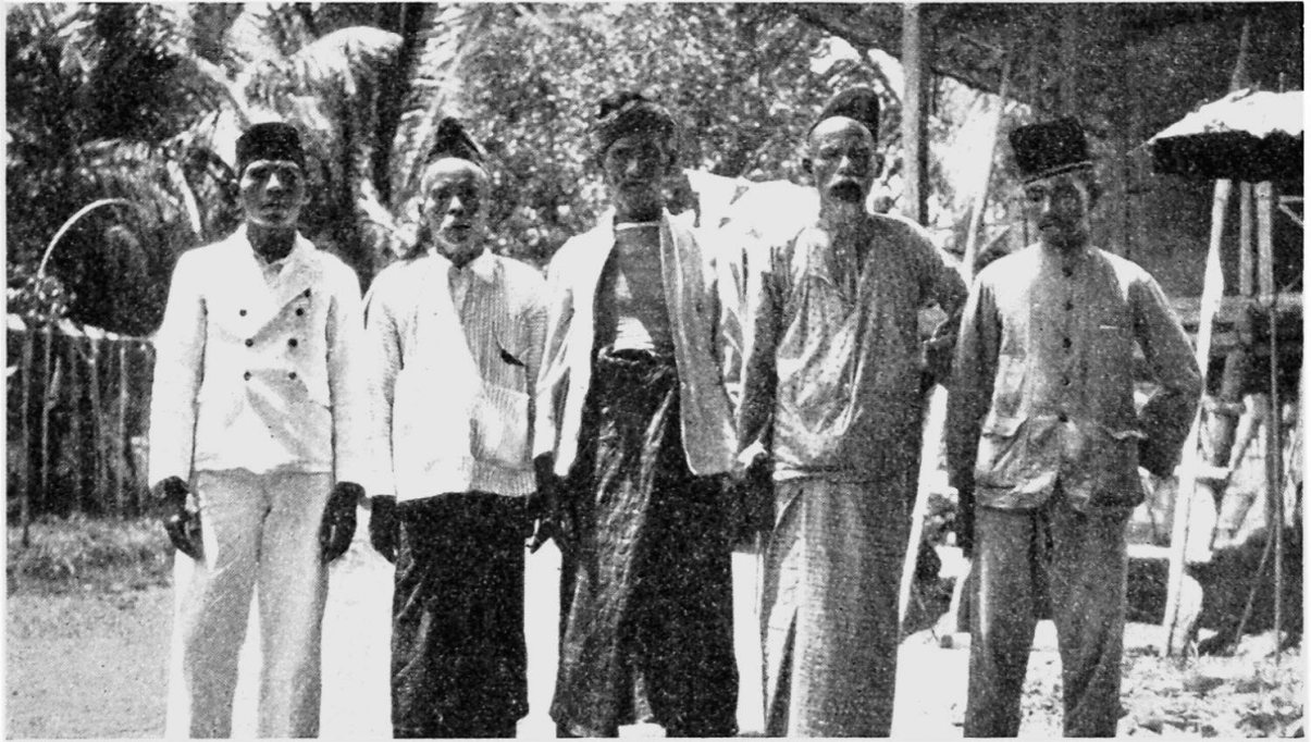
Notables du village Rimbaia (Radja na IX et na X), Photo Institut Colonial, Amsterdam.

11. Race . Selon la tradition, les Toba-Bataks sont partis de leur pays il y a sept « sunduts » ou générations, donc il y a à peu près deux siècles; le groupe actuel Radja na Sepoulouh a pris la direction sud-est, le groupe Radja na Sembilan est resté dans la contrée de la Marbau. On dit que le plus ancien établissement du Radja na Sepoulouh est Sopolangat Oulou; les gens disent être venus de Muara Toba, marga Ritonga. Vers 1890, Hadji Abdœrachman de Padang Sidempuan s'établit à Pasang Lela et prêcha l'Islam à la population païenne. En 1934, il y vivait encore, fort âgé et très respecté.