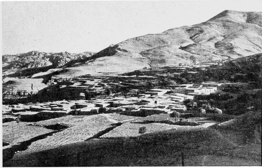
Fig. 3 Wadi Moussa. Village dont l'architecture est adaptée au terrain: toits en terrasses et cultures en terrasses

Aujourd'hui, quand on parcourt la Palestine, on rencontre un peu partout des villes de tentes, non pas les tentes noires des Bédouins, ni des tentes de touristes, mais les camps des réfugiés, ces gens qui habitaient avant la guerre les villages et les villes qui sont maintenant aux mains d'Israël. Ils auraient pu rester chez eux, dit-on, beaucoup de ceux qui sont maintenant réfugiés avaient essayé, mais ils ont dû partir à leur tour et maintenant ils attendent de pouvoir rentrer dans leurs foyers, vaine espérance, car ces foyers sont ou bien détruits ou bien occupés par des immigrants juifs. Ils végètent grâce aux secours que leur fournissent des Nations-Unies, mais combien de temps cela durera-t-il encore ?