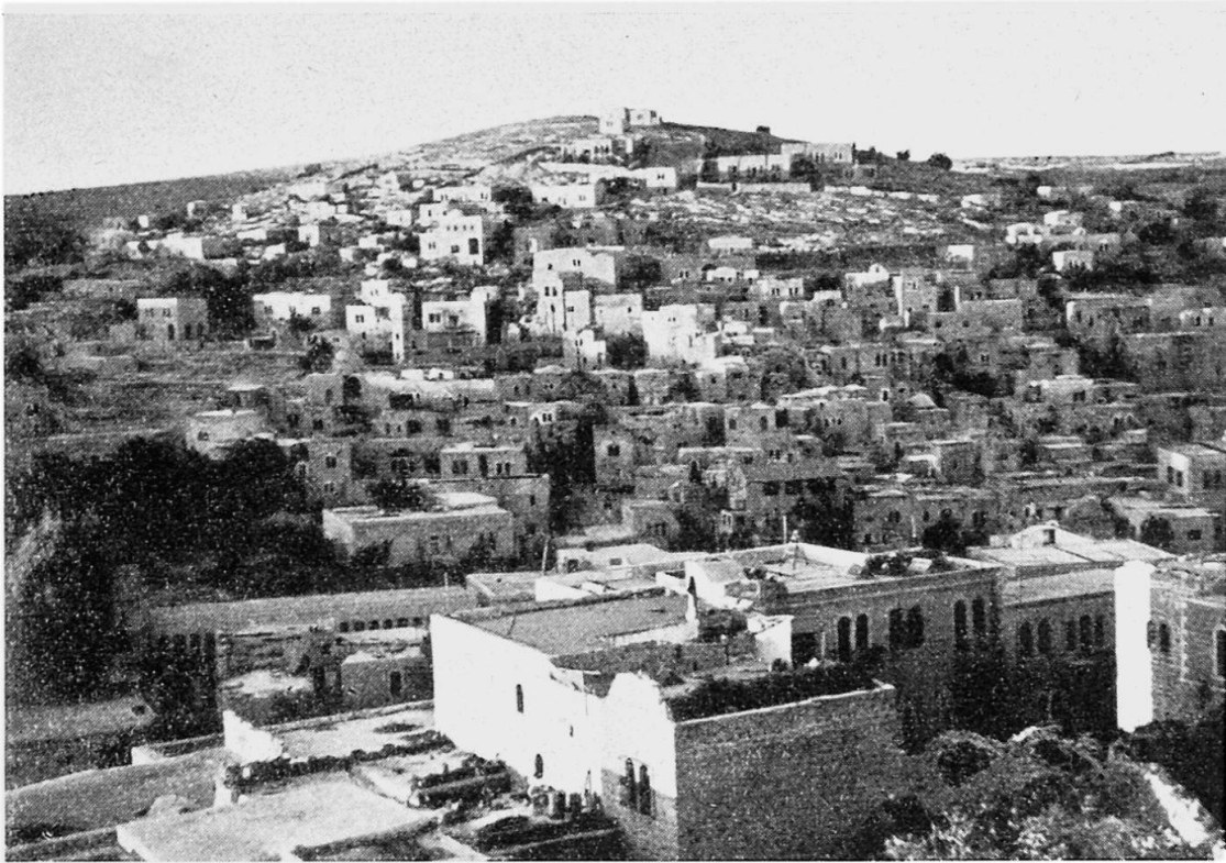
Fig. 2 Hébron. Quartier typique de ville jordanienne musulmane avec maisons à toit plat et fenêtres jumelées

un voyage sous terre jusqu'à cet endroit. A l'Ouest, c'est le « no man's land » : maisons ruinées, restes de barricades, fils de fer barbelés qui rappellent la guerre récente ; au delà, la nouvelle ville, les quartiers modernes de Jérusalem, toute la partie commerçante, sont aux mains des Juifs qui y ont établi leur capitale. Le contraste est extraordinaire entre les deux villes, la Porte Mandelbaum, l'unique passage entre les deux Etats, est la frontière entre deux mondes : le monde arabe fidèle aux traditions et qui n'a guère changé depuis deux mille ans ; le monde juif qui s'efforce de ressembler à l'Occident et tout spécialement aux Etats-Unis. Du côté juif, ce sont de grandes maisons pareilles à celles que l'on peut trouver dans n'importe quelle ville européenne ou américaine, de larges rues, de beaux magasins ; du côté arabe, ce sont les petites maisons de pierre recouvertes d'une coupole, les ruelles étroites et tortueuses, les souks odoriférants, les monuments historiques, tels que l'Eglise du Saint Sépulcre ou la Mosquée d'Omar.