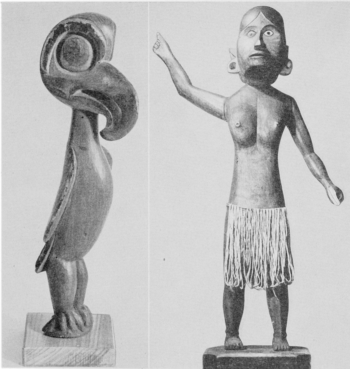
Fig. 1 (links) Hölzerne totemistische Vogelfigur der Kwakiutl (nordwestamerikanische Küstenindianer) Höhe 33 cm. Fig. 2 (rechts) Große hölzerne Geisterabwehrfigur mit beweglichen Armen, die vor dem Hause aufgestellt wird. Nikobaren. Höhe 90 cm.