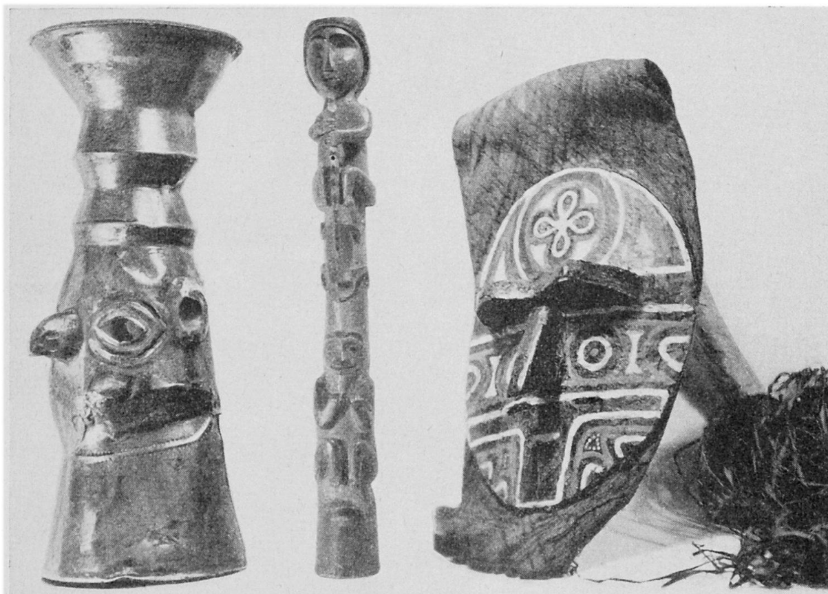
Fig. 3 Silberner Kopfbecher aus Chan-chan (Peru) 25×9,5 cm. Fig. 4 Hölzernes bemaltes Totempfählmmodell der nordwestamerikanischen Indianer. Höhe 58 cm. Fig. 5 Aus Harz und Pech verfertigte Maske der Matapis (Caquetà-Gebiet Ostkolumbiens) mit braunem Rindenstoffumhang, Maske 29×24 cm.

Räumlichkeiten. Das bisher vom theologischen Seminar benutzte Zimmer 227 wurde als Bibliothekraum eingerichtet und bereits im Sommer 1956 in Betrieb genommen. Ein im hinteren Teil der Sammlung gelegener Raum wurde als Magazin- und Arbeitsraum eingerichtet und der früher