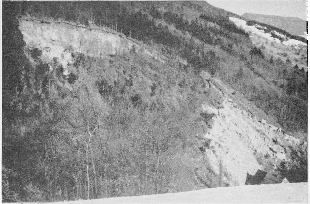
Abb. 1 Felssturz an der Egg bei Obererlinsbach (Aargauer Faltenjura) im Februar 1957