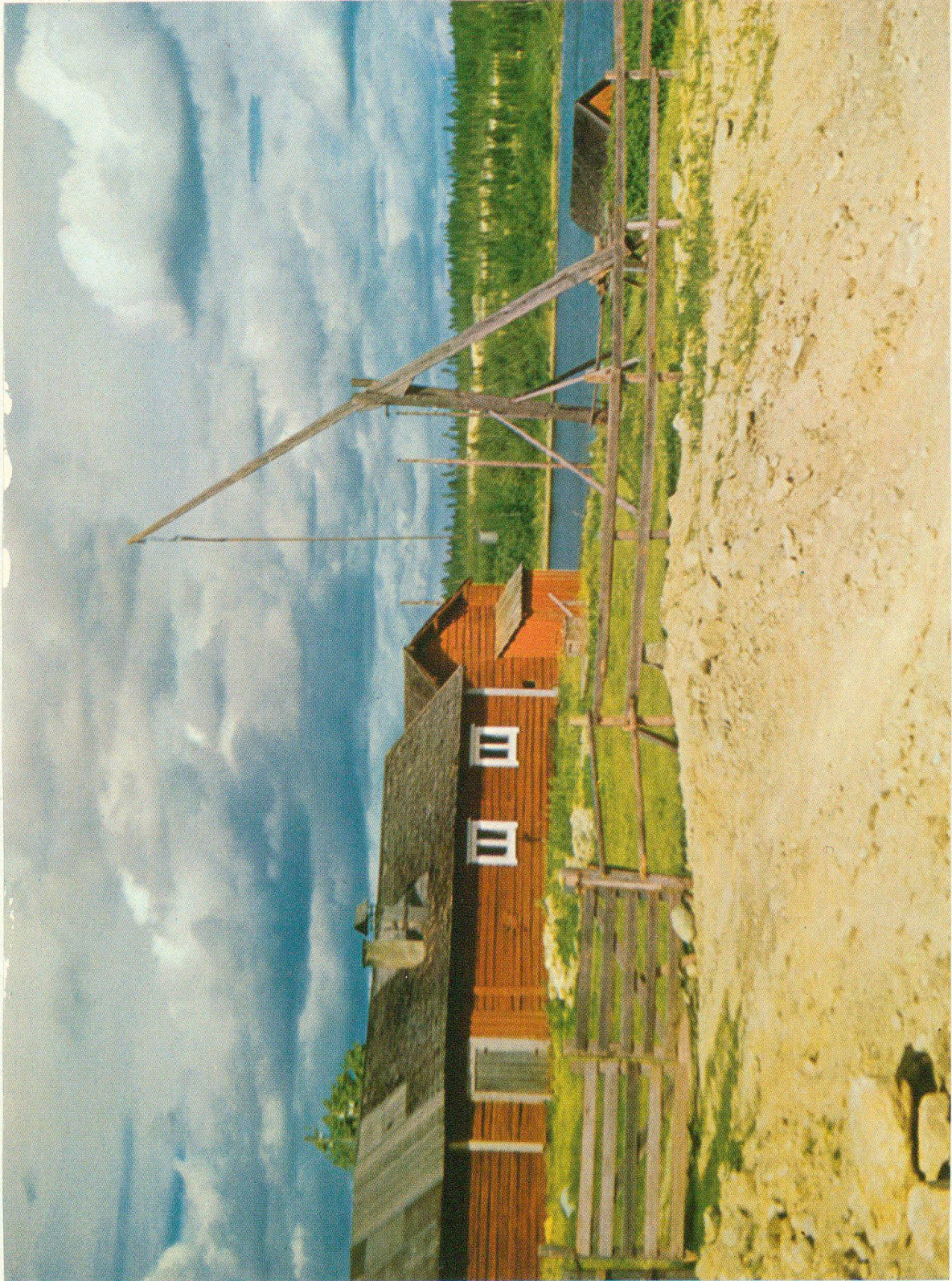
Bauernhof mit Zieh- brunnen an der Straße nach Kilpisjärvi in Lappland