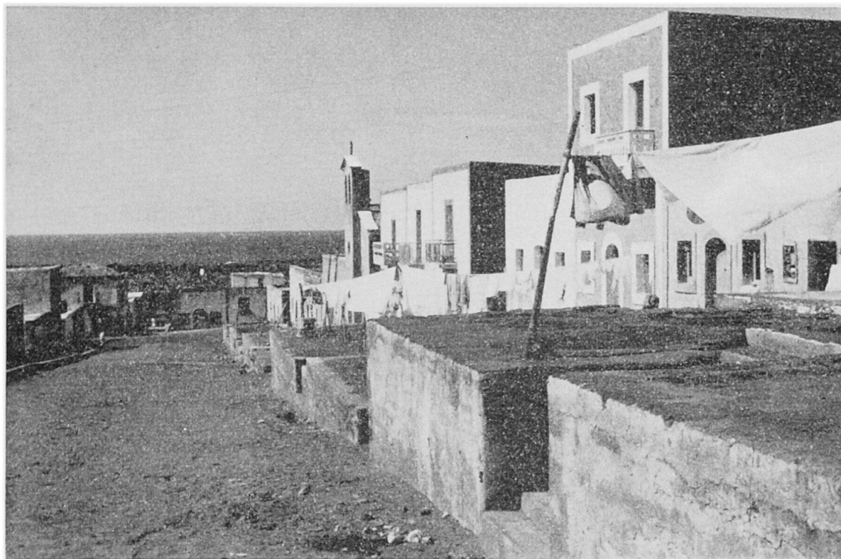
Abb. 2 Linosa, Via Vittorio Emanuele

Vor 5 Generationen hatten sich 16 Siedler mit ihren Familien hierher gewagt, nachdem ihnen die Regierung eine Unterstützung zugesagt hatte. Was die Großväter damals alles erlebten, wissen uns die Ältesten im Dorfe noch genau zu erzählen. In den Höhlen der nahen Tuffelsen vegetierten sie am Anfang, zusammen mit ihrem Vieh, bis der Staat im Laufe der zweiten Generation die Häuser bereitgestellt hatte. Die Anlage der Siedlung erklärt sich allein aus der staatlichen Planung und Ausführung: Breite und gerade Hauptgasse, Konzentrierung von Kirche, Schule, Gemeindehaus,