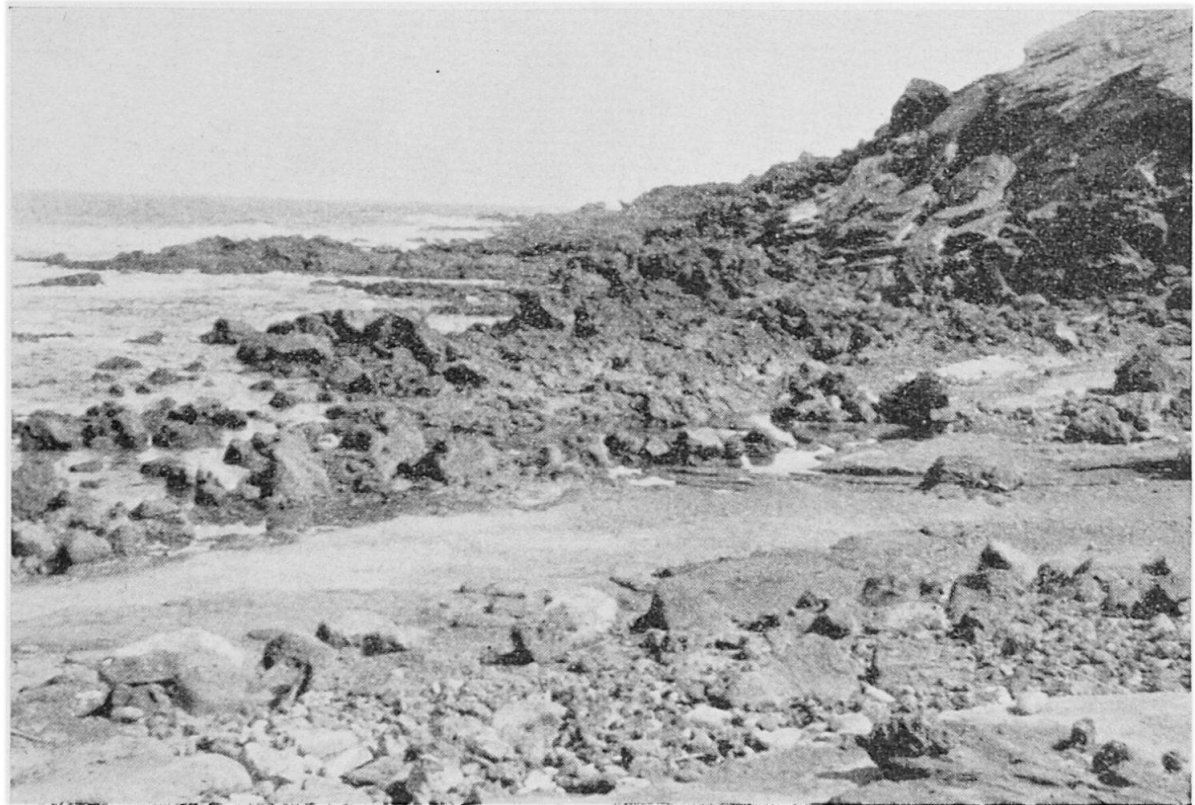
Abb. 1 Linosa, Küste am Mte. Biancarello: Lavaströme stoßen unter Tuff hervor.

uns haben, von dem ein Teil abgesprengt wurde oder entlang von Brüchen im Meer versank. Diese Bewegungen äußern sich aber auch als Klüfte und Verwerfungen in den Tuffschichten, sowie in einem größeren Bruchsystem, das die ganze Insel in verschiedenen Richtungen durchsetzt. (siehe geologische Karte). Diese geologischen Spezialuntersuchungen stehen nicht zusammenhanglos in unserer Gesamtarbeit. Sie verweisen auf die Ursachen der gegenwärtigen Bodenformen und auf die Art des Bodens, besonders weil die Humusschicht nur schwach ausgebildet ist. Die Morphologie begründet die natürliche Gliederung des Landes und bestimmt weitgehend die Siedlungsanlagen. Die Bodenarten scheiden deutlich das bewirtschaftete Land auf tuffig sandiger Grundlage vom mageren Allmendland auf den Schlacken der Steilhänge oder den Basalten der Küstennähe (Abb. 3 und Karte 2).