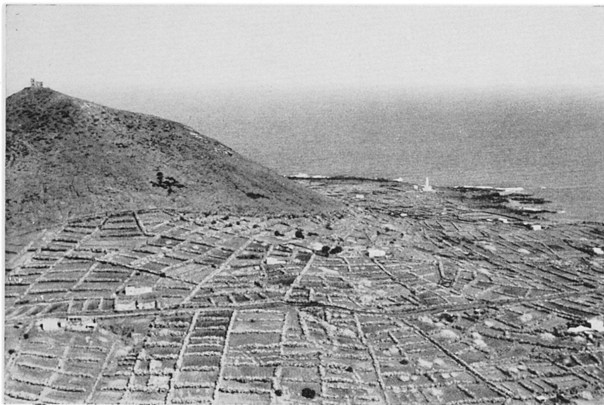
Abb. 3 Linosa: Küstenebene und Montagna Rossa von Mte. Vulcano aus.