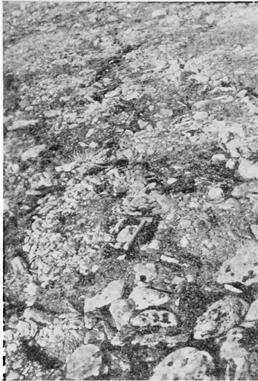
Abb. 1 Steinringe am Laktatjokko (Hammer zum Vergleich).

b) Die Form der Schutt-Tropfen. Die charakteristische Form dieser Schuttbildung scheint mir nicht streng an die hier beschriebene Art der Schutt-Tropfen gebunden zu sein. Wir finden diese Tropfenform gelegentlich auch bei den Stein- und Schutt-Strömen, also bei Schuttbildungen, deren Anfang an keine Nische oder Mulde gebunden ist (vgl. Nr. 4). Wie überhaupt auf Grund der Strömungserscheinungen zu erwarten ist, muß es sich hierbei um eine allgemeinere Erscheinung handeln, die bei allen hier beschriebenen Schuttbildungen des Solifluktionsbereiches auftreten kann.