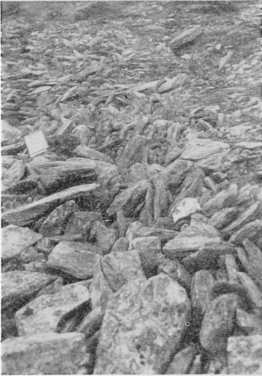
Abb. 3 Teilansicht eines Schuttstromes am Slattajakko (Kartentasche zum Vergleich).