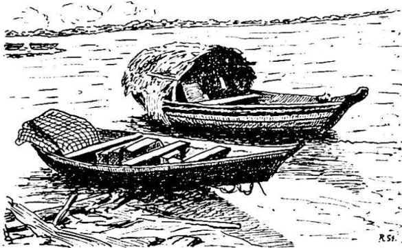
Canoas mit Schutzdach (Igarité)