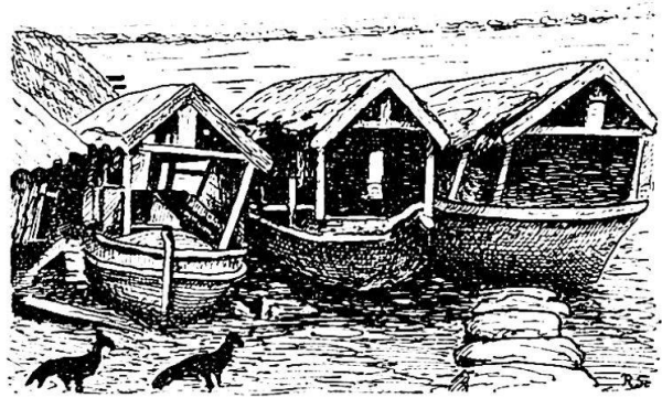
Canoas mit Hüttenaufbau (Batalaõs)