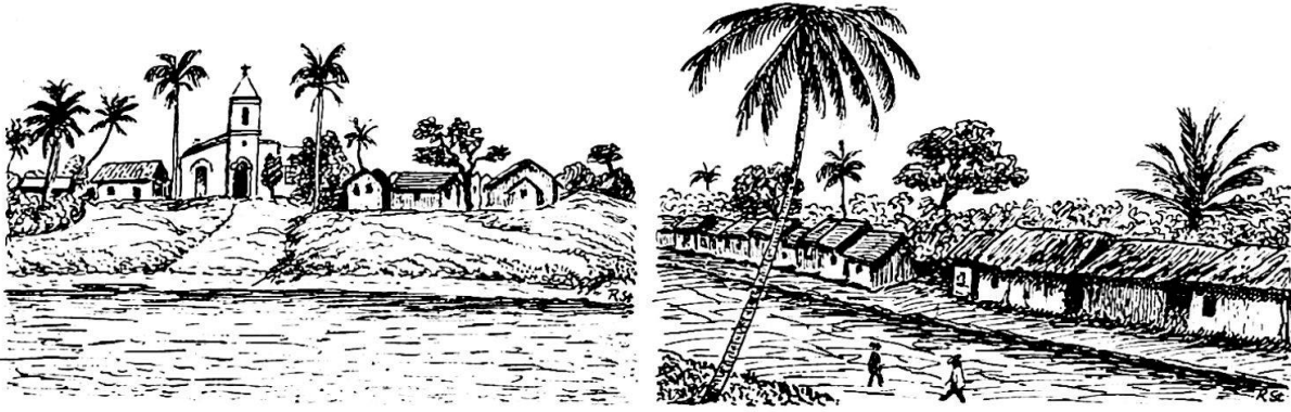
Caoioè, Hauptort im Tal des Rio Negro. Rechts die Hauptstraße