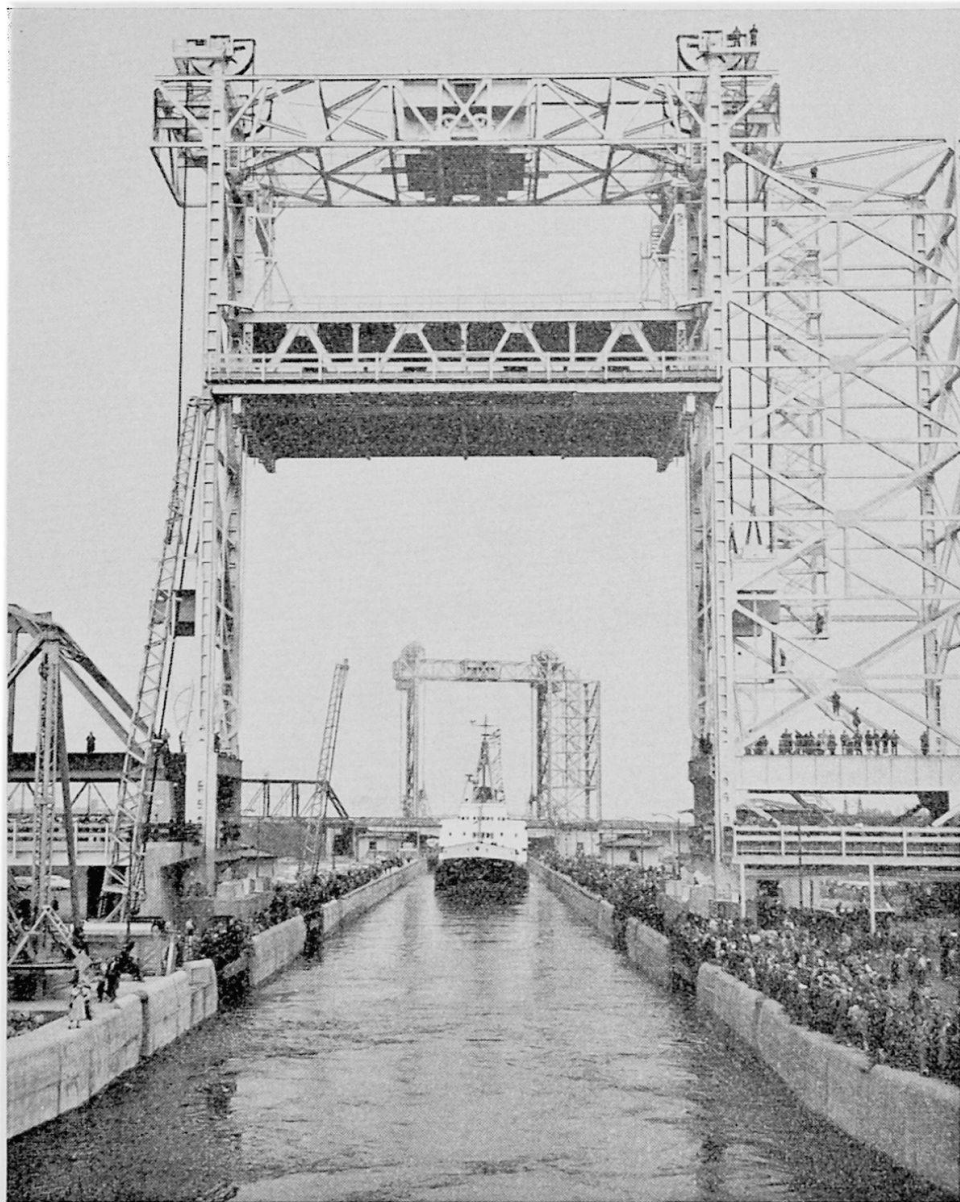
Die St. Lambert-Schleuse am 26. Juni 1959. Die Yacht der englischen Königin durchfährt den Schleusenkanal anlässlich der Einweihung des St. Lorenz-Seeweges.

Rohstoffe eine Vermehrung verschiedener Industrieunternehmungen, so etwa der Zuckerraffinerien und Kaffeeröstereien um Chicago und andernorts. Zudem werden aus dem verbilligten Güterverkehr namentlich die Exportindustrien wie die Autobranche und die Industrien landwirtschaftlicher Maschinen profitieren, obgleich umgekehrt hieraus auch die ausländische Konkurrenz Nutzen ziehen wird. Wenn in diesem Zusammenhang für den wichtigen Umschlagshafen Montreal ernste Befürchtungen laut geworden sind, die darauf hinweisen zu müssen glaubten, daß ihm der Umlad der Güter (Getreide) von den canälern auf die Ozeandampfer verloren gehen werde, so scheint sich diese Prophezeiung kaum zu bewahrheiten. Die Vorteile, die auch Montreal von der Verbesserung des Seeweges erhofft, sollen allen Mutmassungen nach die Nachteile durchaus überwiegen. Sonst hätte wohl kürzlich kaum der National Harbours Board einen Kredit von 57 Millionen Dollar für den Ausbau seines Hafens, vor allem auch für neue Getreidesilos bewilligt. Daß übrigens auch hier mit einer verstärkten Industrialisierung zu rechnen ist, beweist die Entstehung neuer Fabriken auf der Südseite des St. Lorenz. Sie wird sicher noch gefördert werden, wenn die Provinzregierung von