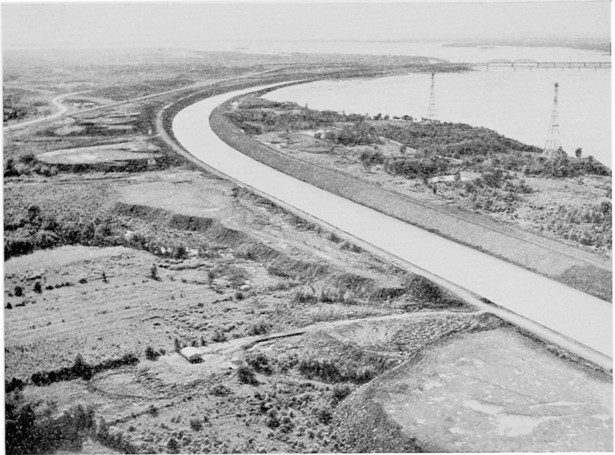
Kanallandschaft an der «Südküste» des St. Lorenz-Seeweges gegenüber Montreal. Der Kanal ist 16 m breit und 27 Fuß tief.

einer noch zu großen Anzahl von Häfen abgesehen sind es nicht zuletzt die Frachtstrukturen der Zubringerdienste (bes. der Bahngesellschaften), die durch die Vielzahl der Häfen gegebenen Zeitverluste bei der Frachtlöschung u. a., die vorläufig noch verzögernd wirken.