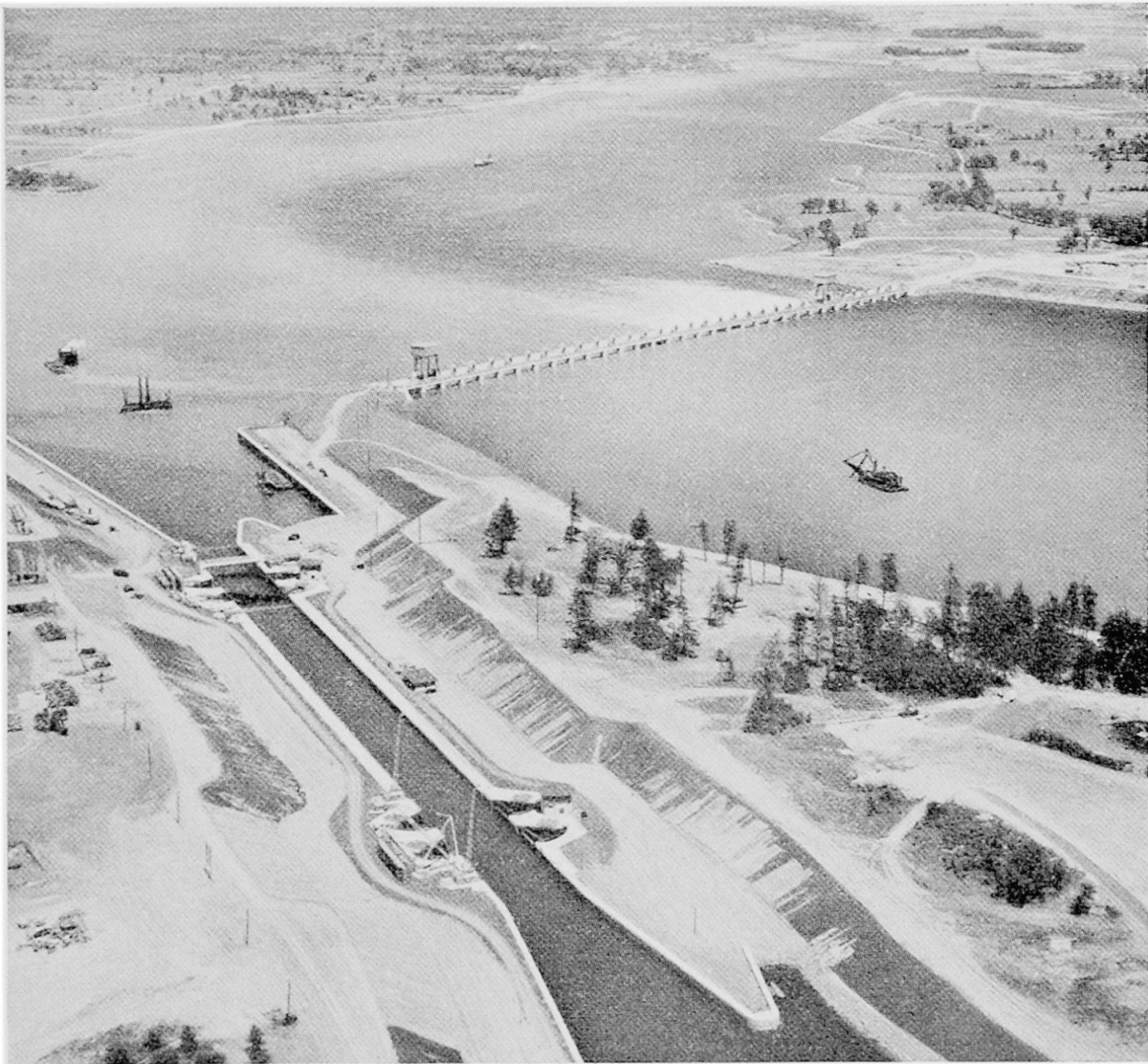
Die Iroquois-Schleuse. Sie leitet die Schiffe um den im Mittelgrund sichtbaren Iroquois-Damm. Links im Hintergrund das neue Dorf Iroquois. In der Umgebung sind zwei neue Dörfer im Entstehen begriffen.

konzentriert, in der Folge aber verteilte sie sich auf das Land. Doch die Industrialisierung im 19. Jahrhundert rief erneut einer Konzentration. Sie hatte allerdings noch um 1870 kaum 20%, um 1900 dagegen schon 50%, 1950 gegen 68% der Bevölkerung der Gesamtregion erfaßt und dürfte gegenwärtig mehr als 70% betragen. An dieser Verlagerung nahmen einige wenige Städte, vor allem Montreal, die größte Stadt Kanadas, Toronto, Quebec, Ottawa, Hamilton und Windsor den Hauptanteil. Mit insgesamt 4,5 Millionen Einwohnern beanspruchten sie 1959 28% der Bevölkerung ganz Kanadas und 43% derjenigen der Region (Provinzen Quebec und Ontario).