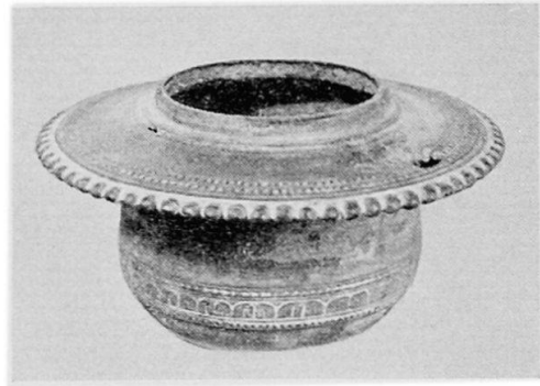
Fig. 1 (links): Hohles Tonggefäß in Form eines gemästeten Hundes, rotbraun und schwarz bemalt, eine Schale auf dem Kopf tragend. Länge: 38 cm. Colima (Mexiko) Katalognummer 12267. — Fig. 2 (rechts): Hindu-javanisches Weihwassergefäß aus Bronze. Durchmesser: Gefäß 12 cm, mit Rand 18 cm, Höhe 9 cm. Katalognummer 12221.