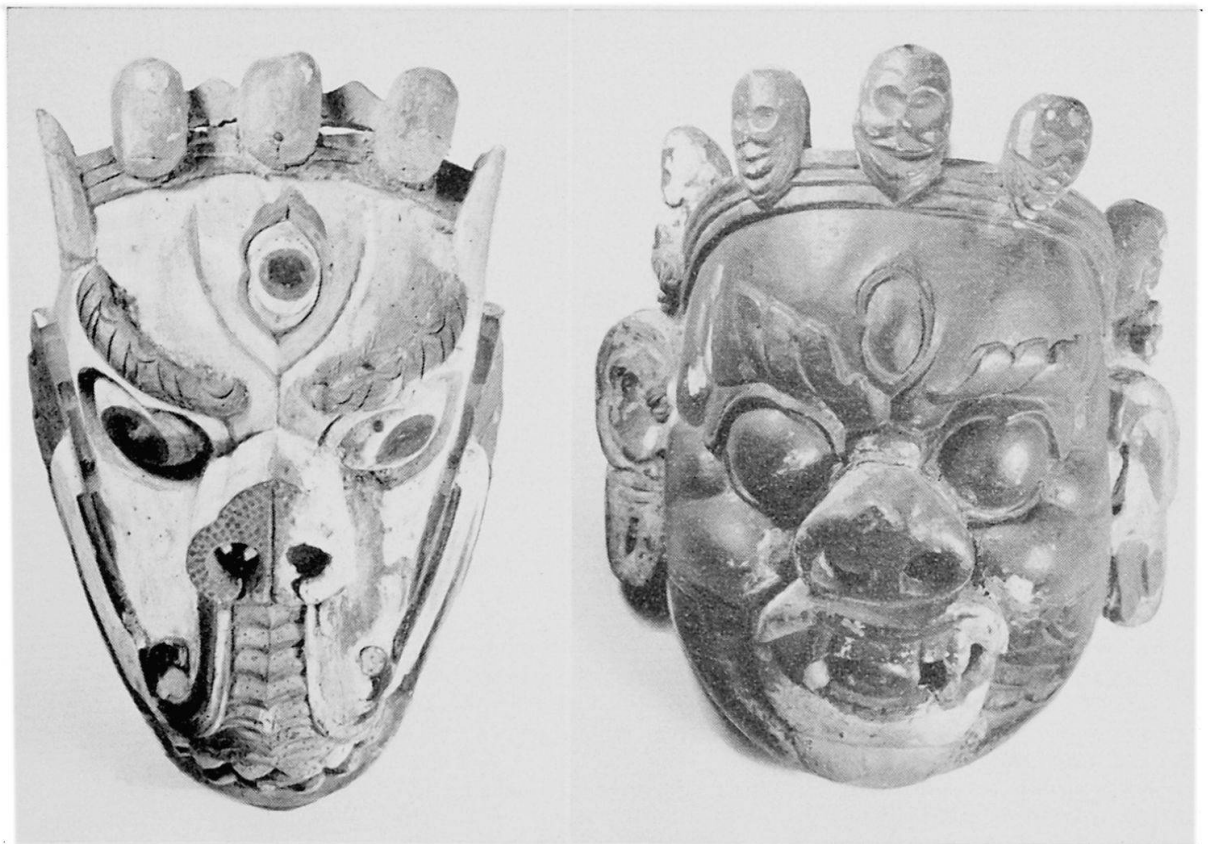
Fig. 1 (links) Nepalesische Löwenmaske «Singhdong Ma», weiß, (Kat. No. 12290), 35 x 27,5 cm. Sammler: Arthur DÜRST. - Fig. 2 (rechts) Nepalesische Maske «Gombo Tschaktschi» aus dem Kloster Samsche Tortscheda, dunkelblau (Kat. No. 12291), 35 x 28 cm. Sammler: Arthur DÜRST. Geschenk der Schweiz. Stiftung für alpine Forschung.

Bauliches, Mobiliar, Organisation und Verwaltung. Im Laufe des Jahres wurden der Arbeitsraum der Konservatorinnen sowie Vorraum und Büro des Vorstehers renoviert, neu gestrichen und mit Neonbeleuchtung versehen. Versuchsweise wurde die Ceylon-Vitrine im Indiensaal mit Neon-Innenbeleuchtung ausgestattet. Für 1960 ist die Einrichtung von Neon-Beleuchtung für alle Abteilungen und für die meisten Vitrinen vorgesehen. Das kantonale Hochbauamt stellte der Sammlung eine