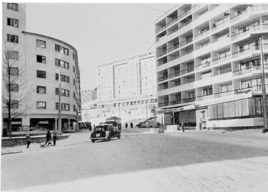
La Chaux-de-Fonds. Quartier ouest

soin que de manœuvres avec un minimum d'instruction. Le climat explique aussi le goût pour la marche, pour les sports en plein air: l'air vif de la montagne invite au mouvement, tandis que l'air lourd des régions basses pousse à la nonchalance.