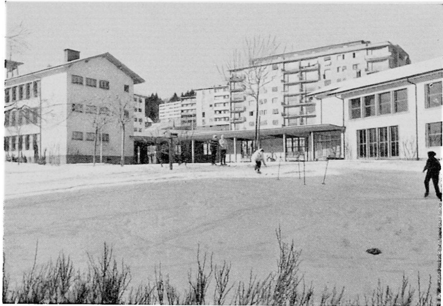
La Chaux-de-Fonds. Au premier plan: Collège des Forges.

d'horlogerie, la Chaux-de-Fonds maintient sa position et actuellement, c'est d'elle que partent près de la moitié des exportations horlogères du pays.