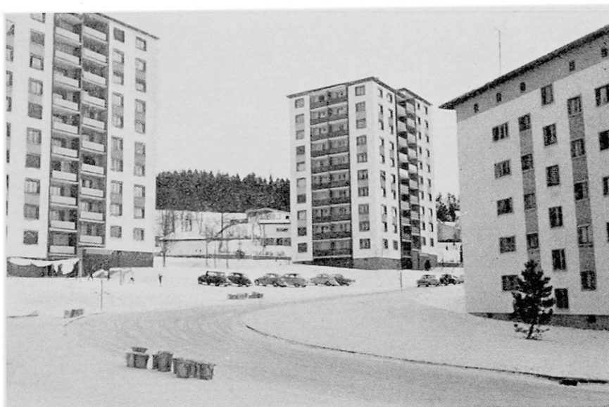
La Chaux-de-Fonds. Quartier des Gentianes.

ceux qui font de grandes courses à pied dans les forêts, les pâturages ou sur les sommets avoisinants. En hiver le ski, le patin ont de nombreux adeptes. En été, la natation est pratiquée par beaucoup. Le besoin d'évasion est tout spécialement marqué à l'occasion des vacances horlogères. Chaque année, en été, toutes les fabriques d'horlogerie ferment leurs portes en même temps, pendant quinze jours. C'est l'occasion de départs en masse à destination des lacs suisses ou des Alpes; nombreux sont ceux qui vont plus loin, sur la Côte d'Azur, en Italie ou même en Espagne. Environ un tiers de la population s'en va.