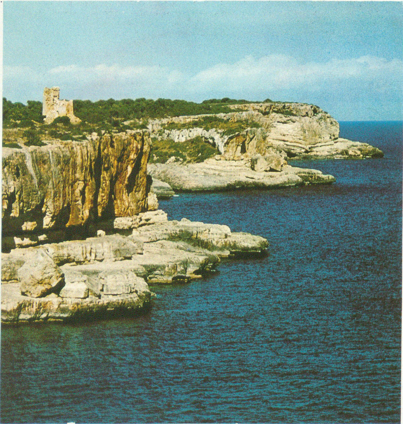
Talayot an der Cala Santanyi. Die vierzig bis hundert Meter steil abfallende Küste der südöstlichen Trockenzone von Mallorca darf als Inbegriff einer Abrasionsküste mit all ihren Formerscheinungen gelten. «Nichts ist so leicht zu überfallen» als eine solche Buchtenregion. Darum der Kranz der Wachttürme, die sie in der Altzeit zu schützen suchten.