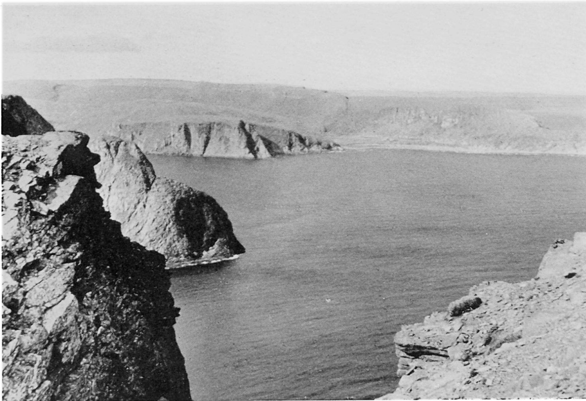
Abb. 4. Blick vom Nordkapfelsen.