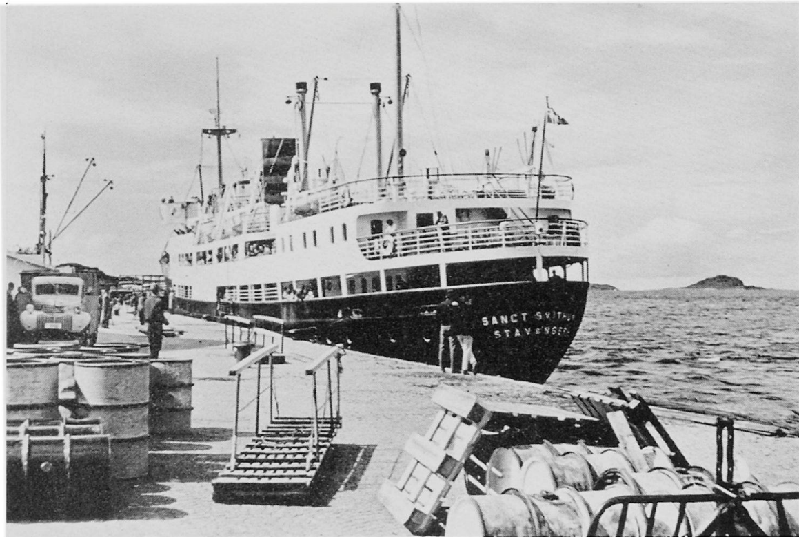
Abb. 1. Sydgående Hurtigruter «Sanct Svithun» (älteres Schiff) in Ålesund.