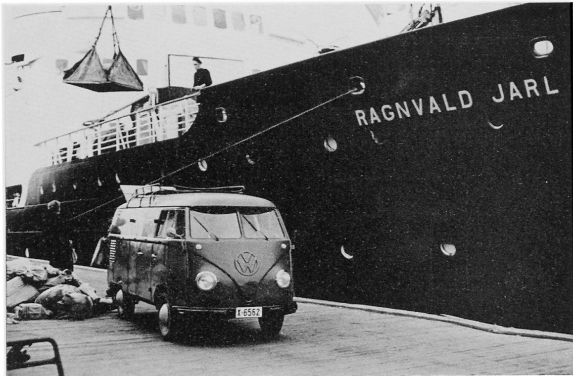
Abb. 3. Sofort nach jedem Anlegen werden die Postsäcke ausgetauscht. Vorn das Auto der «Königlichen Post».

Als gutes Beispiel für ein solches Schiff folgen einige Angaben über den 1956 in Hamburg gebauten «Ragnvald Jarl»: