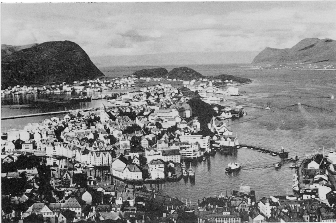
Abb. 2. Blick vom Aksla aus auf Ålesund (25 000 E.), die große Fischereistadt Norwegens (Hering).

achtenswerte Strecke von rund 100 000 km zurück. Für alle Schiffe der Hurtigrute ergibt dies fast 1,5 Millionen Kilometer oder 36 Erdumfänge.