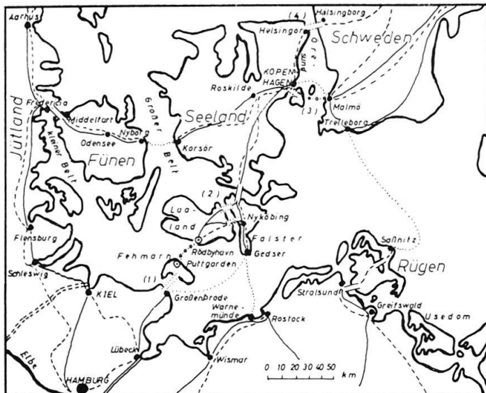
Die nordeuropäischen Meerengen als Landbrücken.