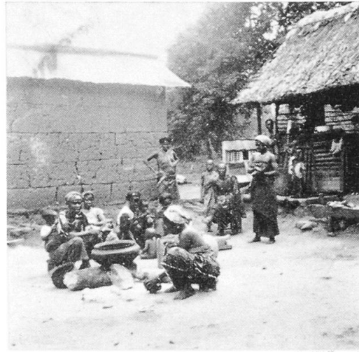
Abb. 1 (links): Gehöfttyp mit getrennten Räumen. Abb. 2 (rechts): Typisches Mehrgebäudegehöft einer Großfamilie. Das Leben spielt sich im Freien ab.

ches Ursprüngliche reliktmäßig erhalten. Auf dem Kroboberg – davon zeugen die wenigen Ruinen – waren die Grundmauern vielfach aus lokalen Steinen aufgebaut. Einige figürliche Darstellungen in der Dachdekoration 3 ausgenommen, findet sich beim Krobobhaus kaum ein Ansatz zum Schmuck.