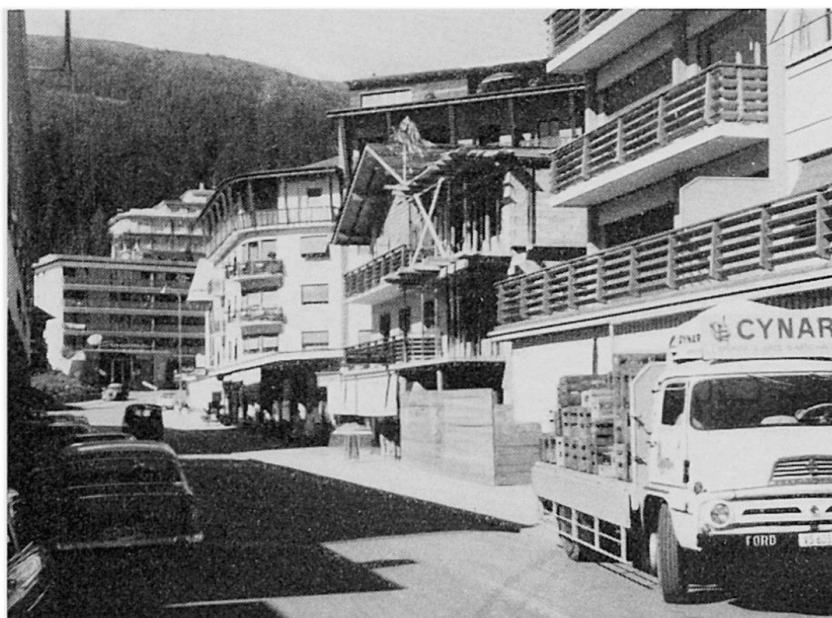
Das erst in den 50er Jahren ausgebaute Zentrum von Crans im Wallis trägt durchaus städtische Züge

Teil beträchtlichen Unterschiede zwischen der Sommer- und der Wintersaison in Rechnung zu ziehen. So kann man, trotz dem stärkern Anschwellen des Motorfahrzeugverkehrs, die sommerliche Periode als die für einen Sport- und Erholungsplatz meist weniger betriebsame bezeichnen. Das Durchschnittsalter der erwachsenen Gäste liegt im Sommer etwa in Wengen über 50 Jahren; im Winter können dort andererseits rund 85% der Gäste als aktive Sportler betrachtet werden. Andere Orte wieder tragen im Winter ein betont mondänes Antlitz zur Schau; neben dem Ski- wird dort der Après-Ski-Betrieb mindestens ebenso wichtig.