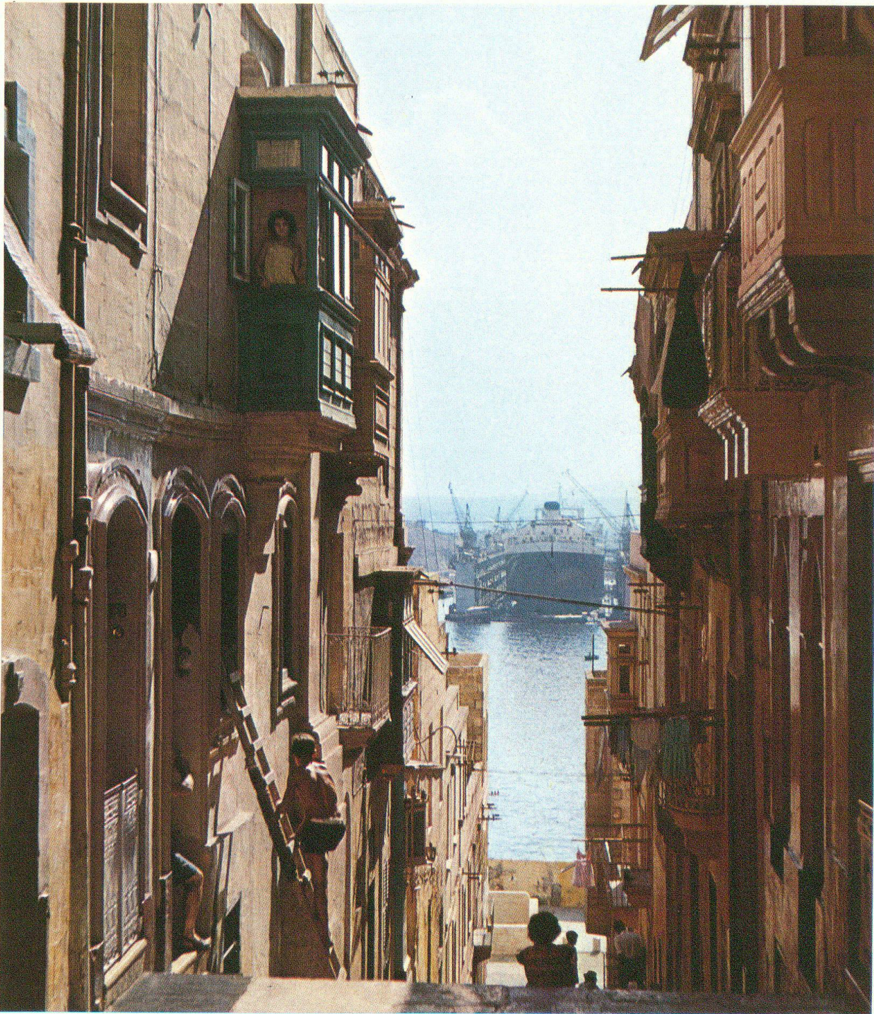
Gasse in Senglea mit Blick auf Schwimmdock

Gleich einer Theaterszenerie spielt sich hier das Leben im einfachen Volke ab, eingerahmt durch die historisch ehrwürdigen Fassaden. Der Baustil spiegelt die Formen alter Mittelmeerkulturen wider. French-Creek, die Hafenbucht, vermittelt Weltoffenheit im Gegensatz zum gutbürgerlichen Kleinstadtidyll.