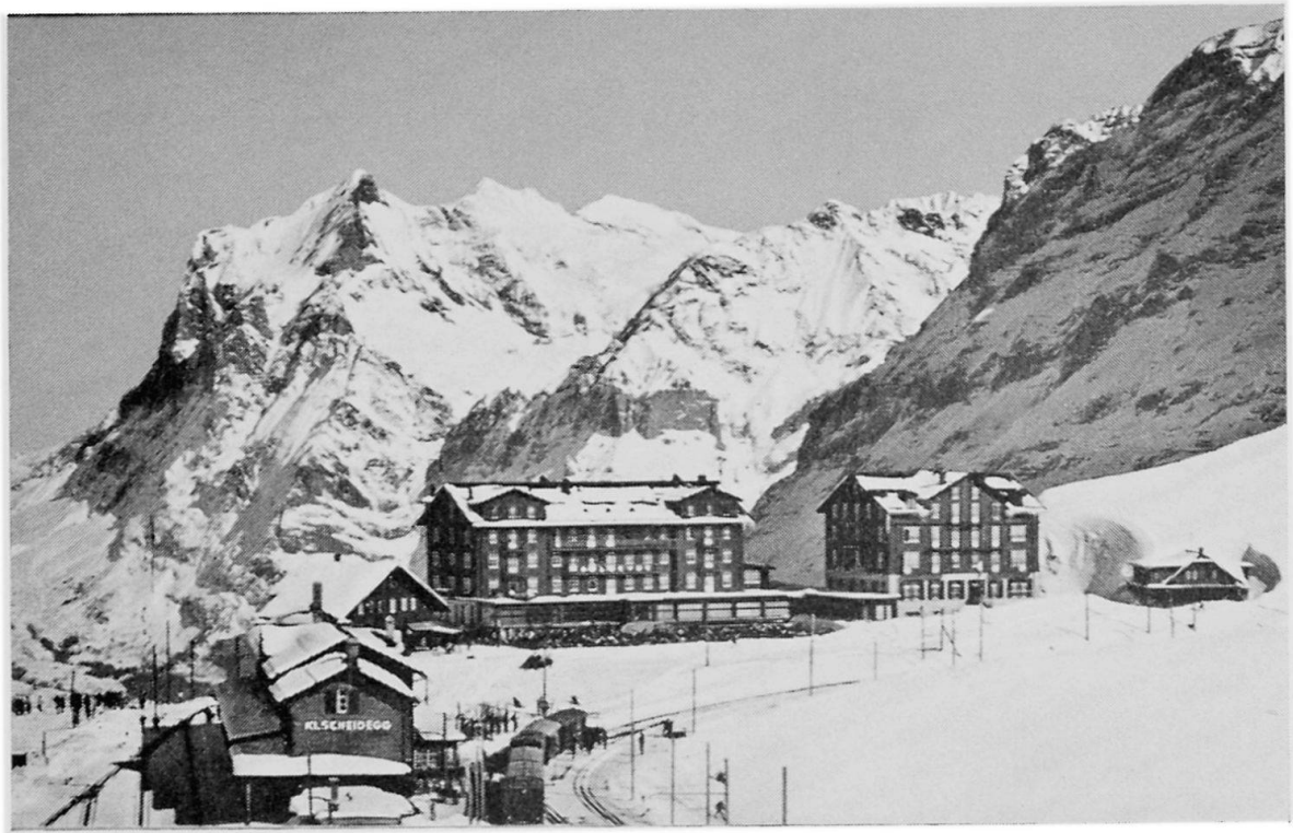
Die Kleine Scheidegg im Winter. Vorne die Station der Wengernalpbahn, daneben die Scheidegg Hotels, in der Mitte «Bellevue», rechts «Des Alpes». Im Hintergrund das Wetterhorn.