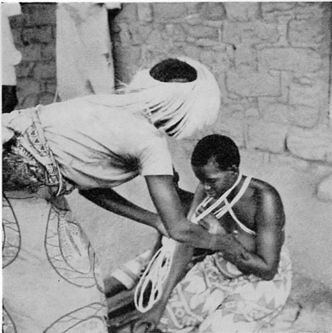
Abb. 3 Eine Braut wird geschmückt

er aufgrund seiner minimalen Heiratsleistung auch keinen Rechtsanspruch auf die Kinder machen. Er durfte aber auch umgekehrt für seine nachgeborenen Töchter kein weiteres Brautvieh verlangen. Hier finden wir also die Grundlage für die grundsätzlich matrilineare Gesellschaftsordnung der Kwaya.