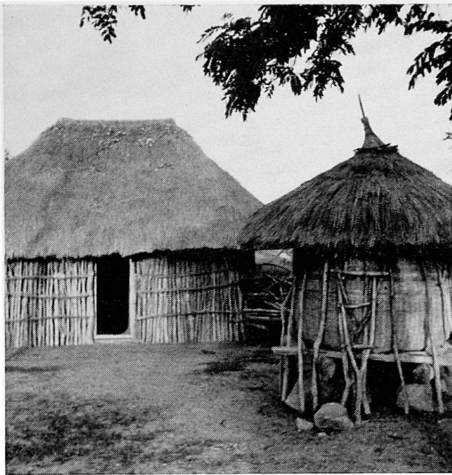
Abb. 1 Wohnstätte und Speicher der Kwaya