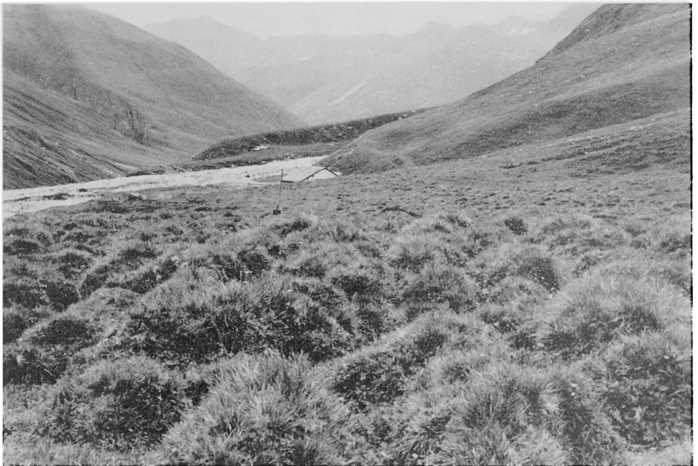
Fig. 1 Büldenwiese der Alp Hinter Bergalga. Blick gegen das Jufertal

Im folgenden wird in dieser Arbeit für die Erdhügel absichtlich das Wort «Erdhügel» oder «Büldenwiese» verwendet und nicht der Begriff Erdbuckel bzw. Buckelwiese, denn nach Höllermann (1964, S. 90) sollten die beiden letztgenannten Begriffe nur für die Erdhügel in Karstgebieten gelten, welche von Ebers (1959, S. 105—111), S. Müller (1959, S. 40—44) und Morawetz (1964, S. 60—63) beschrieben worden sind.