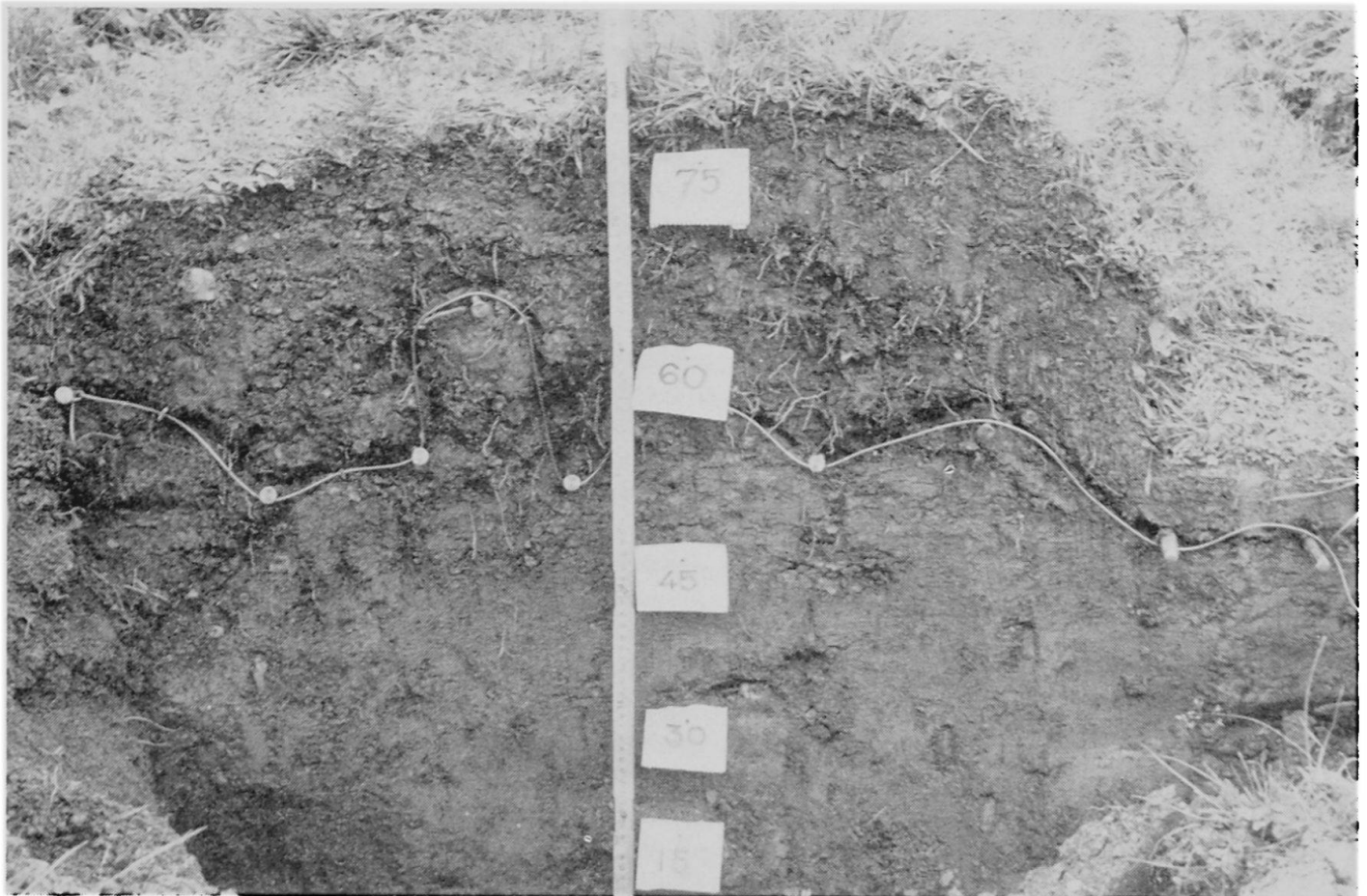
Fig. 2a Aufgegrabene Erdbülte, Grenze Lehm-Humus mit Nylonschnur markiert; Angabe der Probenentnahmen für die Korngrößenanalyse.