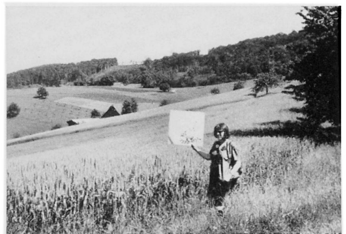
Abb. 1 Mit erhobener Signaltafel wird der Kartierungsbefund an die stationäre Plan-Stelle übermittelt. Dort erfolgt die lagerichtige Eintragung in den Plan.

Das Problem der gegenseitigen Verständigung mußte auf technischem Wege gelöst werden, weil der Abstand zwischen P-S und G-S meist so groß war, daß eine direkte sprachliche Verbindung nicht mehr zustande kam. Als erstes und einfach zu beschaffendes Kommunikationsmittel wurden Signaltafeln erprobt; danach konnten sogar Kleinfunkgeräte eingesetzt werden.