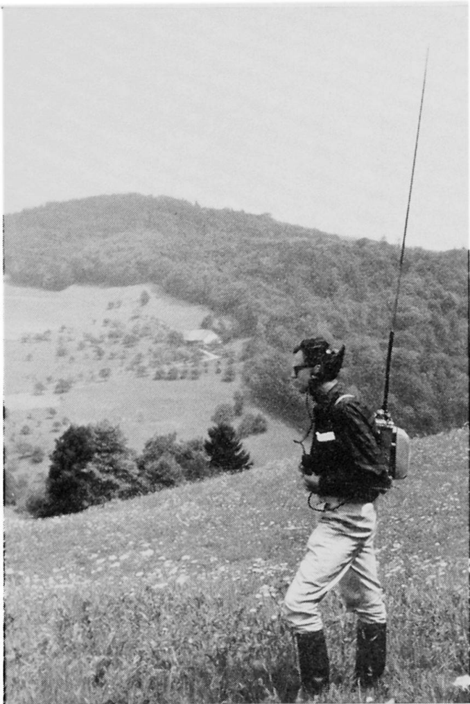
Abb. 2 Das tragbare SE-101 gestattet dem Mitarbeiter im Gelände eine große Bewegungsfreiheit. Er kann sich auf die Detailabklärung im Gelände konzentrieren.

Wir kartierten über Signalisierstrecken bis zu 600 m, und zwar optisch zufriedenstellend. Obwohl die Hilfsmittel für die Signalkartierung technisch einfach und billig zu beschaffen waren und nach guter Einübung befriedigend eingesetzt werden konnten, besteht der eine Nachteil — wie bei jeder optischen Information — darin, daß die Signalsprache versagte, wenn unvorhergesehene Informationen nötig