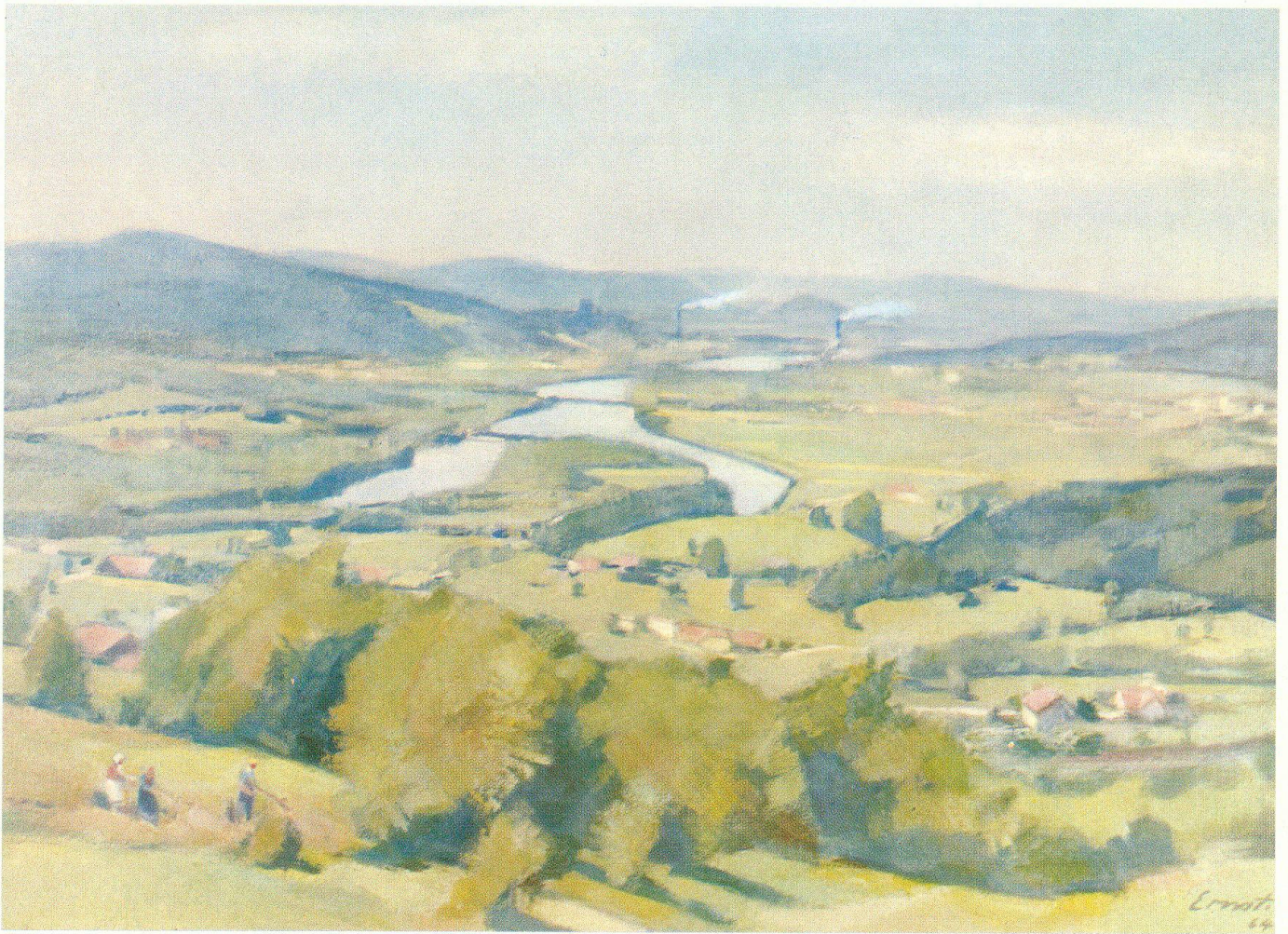
Das Ölbild des Kunstmalers Otto Ernst (1884—1967), Aarau, zeigt die Kulturlandschaft des Aaretales von Vierlinden an der Bözbergstraße (Zürich—Basel), einem bekannten Aussichtspunkt. Von der Aare zweigt beim Stauwehr der Oberwasserkanal ab. Oberhalb sind die breitgestaute Aare und die Brücke von Schinznach-Bad sichtbar. Am Fuß des Bözberges liegt Villnachern, auf der rechten Talseite sind Schinznach-Bad und Holderbank, auf der linken Veltheim sichtbar. Im Hintergrund rauchen die Hochkamine der Zementfabriken von Holderbank und Wildegg, beide im ehemaligen Schachengebiet. Am Taleingang befinden sich die Schlösser Wildegg und Wildenstein, welche mit der (auf dem Bilde nicht sichtbaren) Habsburg im Mittelalter den Durchgang beherrschten. Bei klarem Wetter sind am Horizont die Alpen zu sehen.