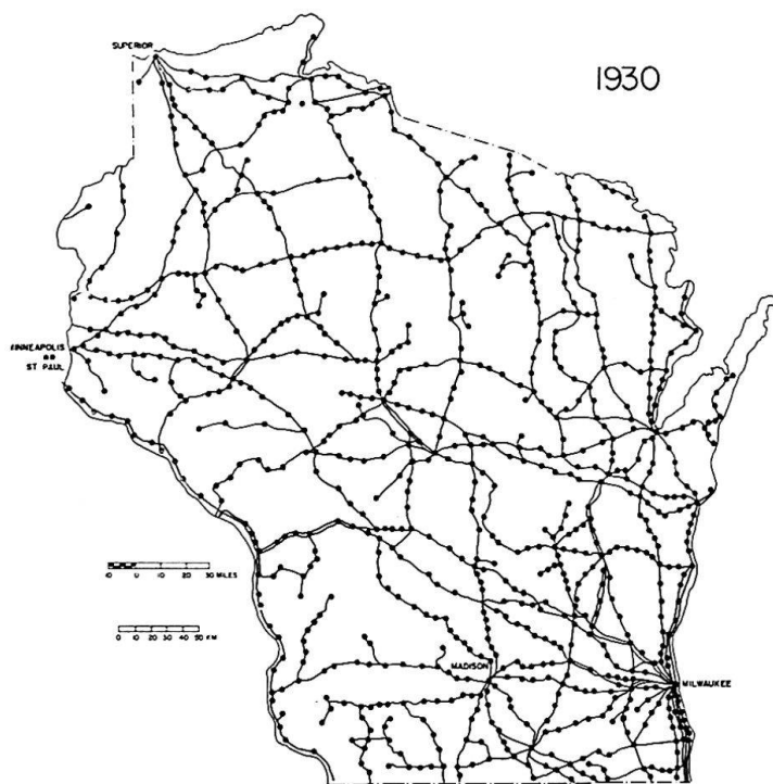
Figure 3. Lignes avec services de voyageurs en 1930