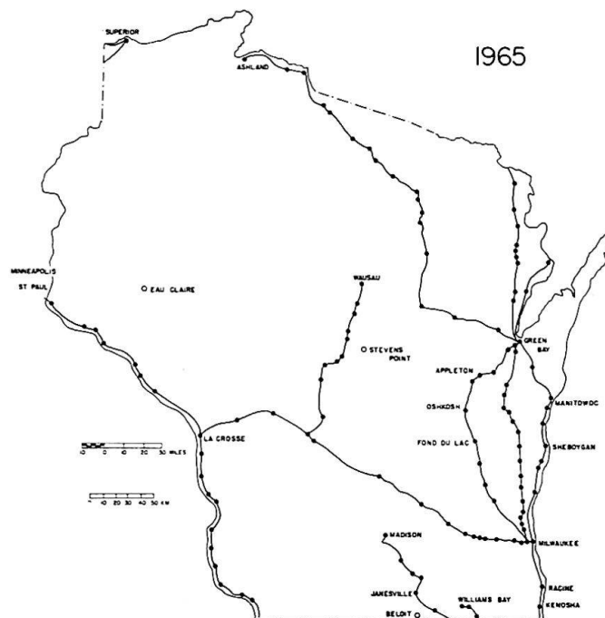
Figure 4. Lignes avec services de voyageurs en 1965

d'une ligne traversant l'Etat en diagonale de Milwaukee à Superior. Il semble cependant que les chemins de fer aient atteint le point de saturation. L'année 1920 marque l'extension maximale du réseau ferroviaire: 12 382 km. Dès 1872, des lignes ont été abandonnées, mais il s'agit avant tout de tronçons peu importants, lignes rendues inutiles par l'établissement d'un raccordement plus avantageux ou lignes en relation avec des exploitations forestières ou minières abandonnées. Dès le début du siècle, cependant, les chemins de fer ont un rival, les transports automobiles. Assez rapidement l'automobile a acquis les faveurs de la population, surtout dans les campagnes et les villes petites ou moyennes. Les compagnies de chemins de fer réduisent le nombre de trains, suppriment les services de voyageurs sur certaines lignes, ou en abandonnent d'autres. Ces changements ne peuvent se faire qu'après une longue procédure, notamment une enquête qui doit établir que les services ne sont pas rentables et que les intérêts publics ne sont pas suffisants pour justifier leur maintien. De ce fait, en 1930, il y a encore des services de voyageurs sur la plupart des lignes, et le réseau est encore assez près de sa plus grande extension 3 . Les principales lignes se répartissent entre quelques grandes compagnies: la «Chicago and North Western», la «Milwaukee Road», déjà notées en 1900, et la «Minneapolis, Saint-Paul et Sault-Sainte-Marie Railroad Company», connue sous le nom de «Soo Line».