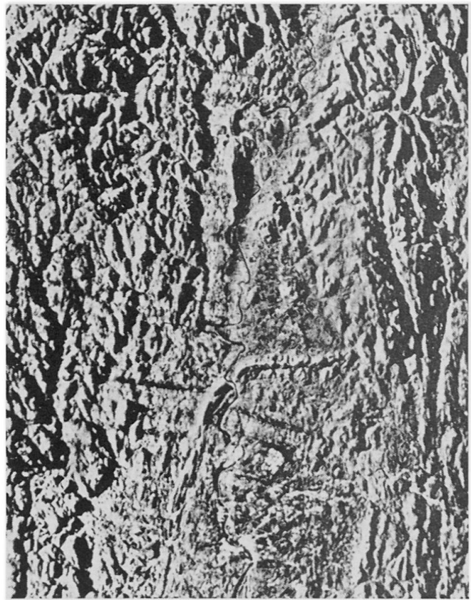
Abbildung 2a und b. Verkleinerter Ausschnitt aus «Side Looking Radar Mosaic of the State of Massachusetts», links die «West-looking», rechts die «East-looking»-Version. Abgebildet ist das Connecticut Valley, flankiert von den Birkshire Hills im W und dem zentralen Hochland im E (N am oberen Bildrand). Deutlich erkennbar sind unten Springfield mit den Brücken über den Fluß, Holyoke in einer Flußschleife, der das Tal querende Riegel der Mount Tom Range (im W), Holyoke Range (im E) und Greenfield am oberen Bildrand.

Die Vorteile und Nützlichkeit derartiger Weltraum-Photokarten, als Ergänzung zur kleinmaßstäblichen topographischen Karte, bestehen in der viel naturgetreueren Geländewiedergabe, ihrem Detailreichtum an natur- und kulturgeographischen Formen (selbst Bahnlinien und Straßen sind klar erkennbar) und ihrer Eigenschaft als historisches Dokument, das einen einmaligen Landschaftszustand festhält.