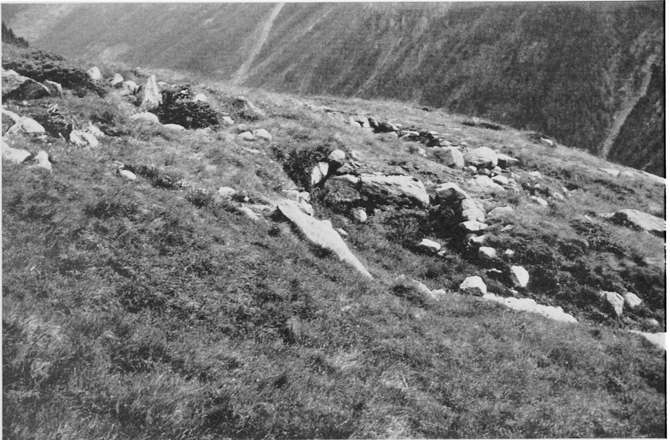
Abbildung 3. Gruppe der Grubenhüttchen auf Schweifinen; im Vordergrund Nr. 8 von Abbildung 2

Am Fuß dieser Geländestufe finden wir nochmals eine Siedlungswüstung, die sich jedoch von der ober genannten völlig unterscheidet. Es handelt sich um vier Häuschen aus Trockenmauerwerk, die nicht in den Boden eingetieft sind. Die Mauern sind unterschiedlich gut erhalten, einzelne Partien nur etwa 50 cm hoch; an einzelnen Stellen finden wir dagegen Bauteile von über 2 m Höhe. Krautige Vegetation weist auch hier auf phosphatreichen Boden hin. Innerhalb und außerhalb der Hütten liegen Latten und Pfähle, die verwittert, aber nicht eigentlich verfault sind. Diese abgegangene Siedlung macht einen viel jüngeren Eindruck als die erstgenannte, die sie umgibt. Man kann sich fragen, ob diese Hütten im Zusammenhang mit dem Saumweg stehen oder ob im 16. bis 18. Jahrhundert nochmals Alpwirtschaft getrieben wurde. 3