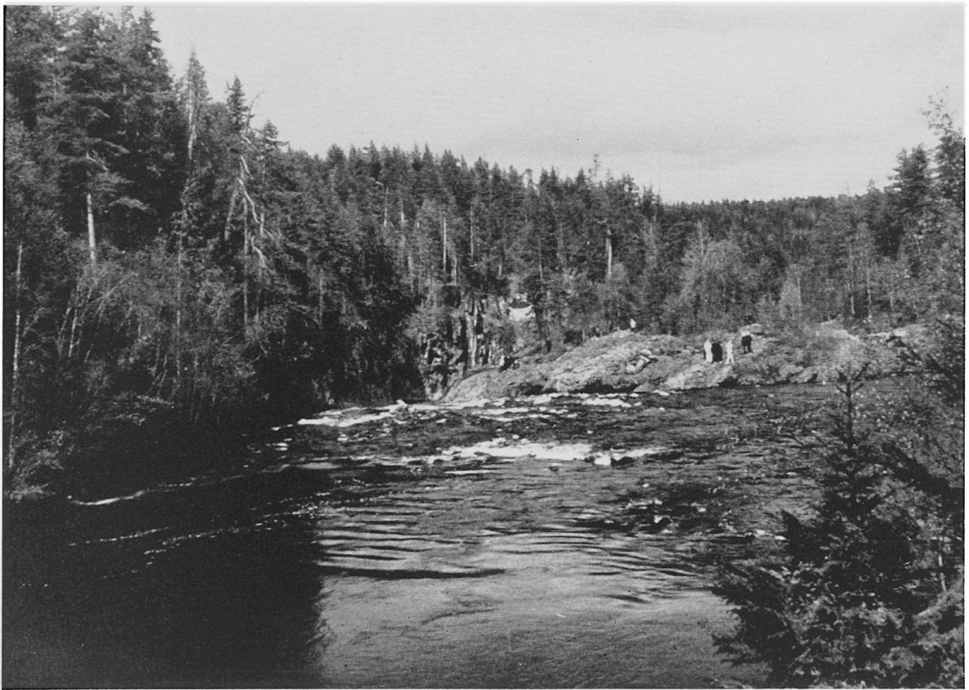
Abbildung 2. Der Fluß Oulankajoki im Nationalpark Oulanka in Kuusamo, Nordostfinnland.

Torf abzubauen und als Brenn- oder Düngemittel zu verwenden.