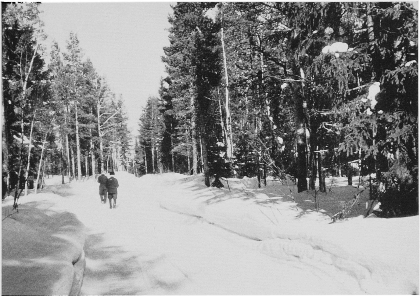
Abbildung 5. Mischwald in Oulainen, im südlichen Teil Nordfinnlands.

Meerbusens. In dessen Nordteil ist das Wasser nur noch schwach salzhaltig; der Salzgehalt beträgt ungefähr 3 Promille. Für die Schifffahrt Nordfinnlands hat der Bottnische Meerbusen große Bedeutung; Oulu, Kemi und Raahen sind wichtige Hafenstädte. Zwar ist sein Nordteil im Winter ein halbes Jahr lang zugefroren, die Schifffahrt kann jedoch mit Hilfe von Eisbrechern zeitweise aufrechterhalten werden.