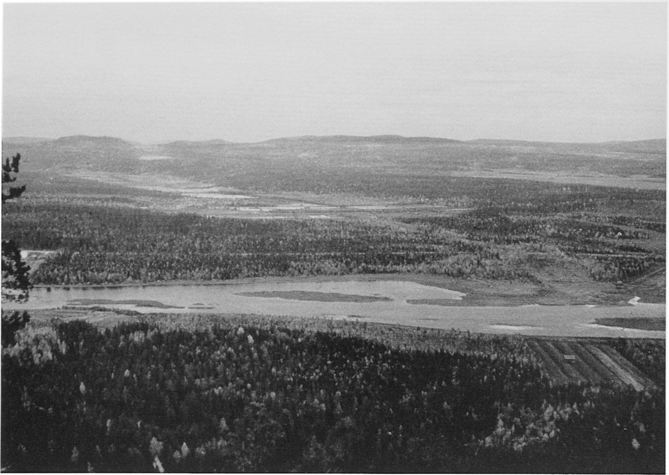
Abbildung 1. Landschaft in Aavasaksa. Wälder, Moore und Flüsse sind die Hauptelemente der Landschaft im südlichen Lappland.

Meeres oder der Seen abgelagert, von wo sie anlässlich der Landhebung über den Wasserspiegel gehoben wurden. Als Ackerböden sind sie jetzt von sehr großer Bedeutung. Lehm- und Sandfelder treten besonders im Küstengebiet des Bottnischen Meerbusens, an den Ufern der großen Seen und längs der Flüsse auf. An den Flußufern liegen auch postglazial entstandene, vom Fluß bei Hochwasser aufgeschüttete Lehm- und Sandfelder.