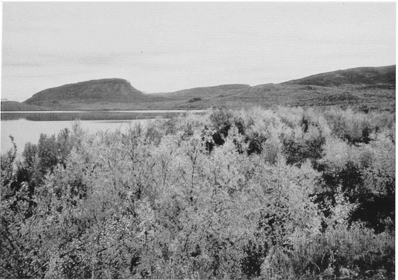
Abbildung 4. Birken-Buschwald in Nordlappland. Im Hintergrund der Saanaberg, 1029 m ü. M.

es eben ist, gibt es hier kaum Einsenkungen, die als Seebecken dienen können. Dazu kommt, daß sich der größte Teil des Gebietes zum Bottnischen Meerbusen neigt und dort keine wasserstauenden Schwel len vorkommen. Seen und Flüsse sind am spärlichsten im Küstenbereich des Bottnischen Meerbusens und in weiten Regionen Nordlapplands, wo ihr Anteil an der Oberfläche sogar unter 5% liegt. In Kainuu und in Nordostfinnland (Gebiet von Kuusamo) sowie in der Gemeinde Inari in Lappland nehmen die Wasserflächen dagegen stellenweise 15–35% der Gesamtfläche ein. In der Provinz Oulu beträgt der Anteil der Wasserflächen ungefähr 7,8%, in der Provinz Lappland 5,6%, in ganz Finnland sogar 10,3% der Oberfläche.