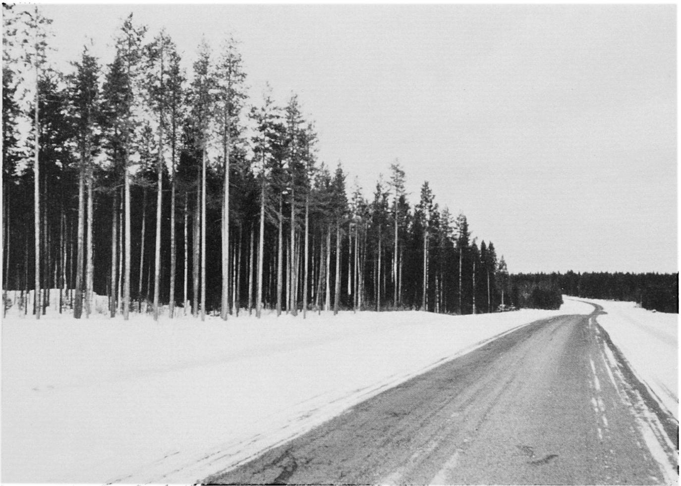
Abbildung 6. Straße zwischen Oulainen und Ylivieska. Die Straßen sind auch in Nordfinnland ziemlich gut.

Nicht ganz Nordfinnland wird jedoch von Wald bedeckt; weite Flächen werden von Mooren eingenommen. Die Grenze zwischen Sümpfen und Wäldern ist nicht immer klar zu erkennen; in manchen Zonen, die eigentlich zu den Sümpfen gezählt werden, wachsen so zahlreiche Bäume, daß sie als Wälder anzusehen sind. Die finnischen Sümpfe werden in drei Haupttypen unterteilt: Sumpfbruchwald (finnisch «korpi»), Reisermoor (finnisch «räme») und offenes, baumloses Moor (finnisch «avosu»). In den Sumpfbruchwäldern wächst ein ziemlich guter Fichten- oder Birkenwald. In den Reisermooren dagegen gedeiht als Holzart am besten die zwergwüchsige Kiefer. Die baumlosen Moore sind, wie schon ihr Name besagt, völlig ohne Baumbewuchs.