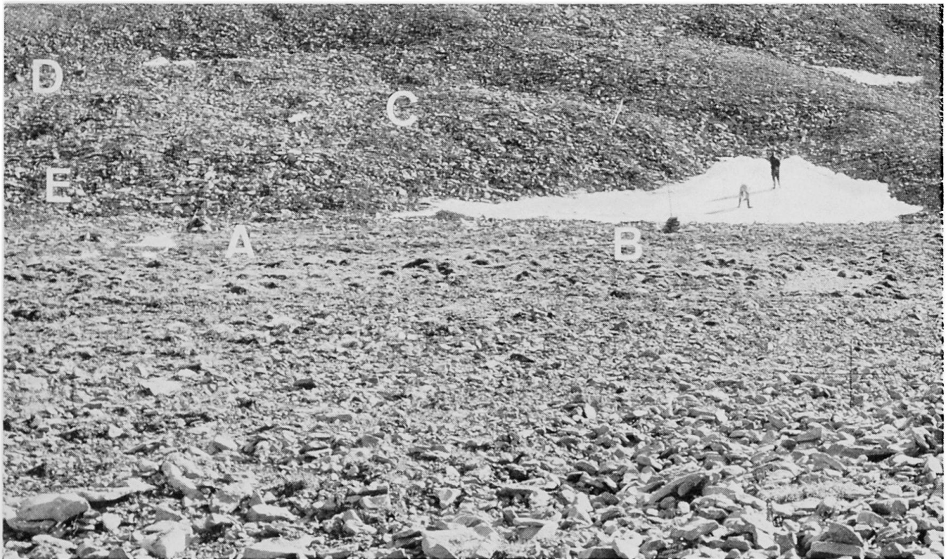
Abbildung 1. Übersichtsaufnahme mit den fünf untersuchten Meßstellen (A bis E)