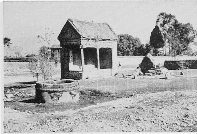
Abbildung 1. Zisternenbrunnen bei Jawlakhel . Der Brunnen wird heute noch für die Versorgung der umliegenden Häuser mit Verbrauchswasser verwendet. Er befindet sich an einer nach Süden führenden alten Ausfallstraße; dies erklärt das im Hintergrund sichtbare öffentliche Rasthaus; rechts von ihm ein hinduistisches Heiligtum. Aufnahme HB März 1968

und irgendwelche Angaben über das Verhältnis Verdunstung – Abfluß – Versickern fehlen, hat es wenig Sinn, rechnerisch-quantitativ an die Frage heranzutreten, welche Mengen alljährlich dem Grundwasserreservoir zufließen. Die vorstehend gemachten Zahlenangaben dienen lediglich einer allgemeinen Orientierung über die Verhältnisse.