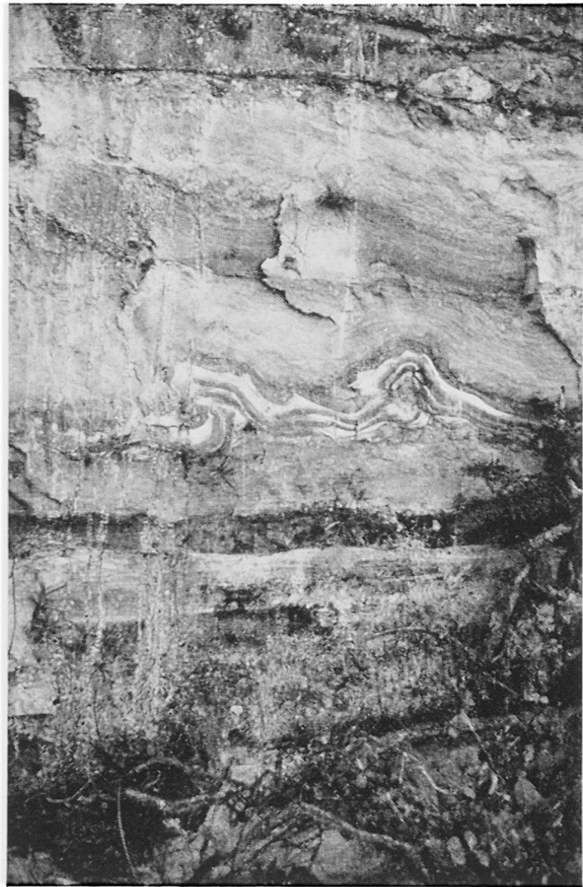
Abbildungen 4 und 5. Details der geologischen Verhältnisse. Links (Abb. 4) erkennt man die diskordante Auflagerung von Schottern der Patan-Serie auf die sogenannten Kalamati-Mergel. An der Auflagerungsfläche findet sich ein rostroter Bodenhorizont. Diese Aufnahme wurde etwa 200 m vom Gebirgsrand entfernt nw von Godaveri gemacht (März 1972). Abb. 5 (rechts) zeigt ein Beispiel der Strukturen, welche man in den Kalamati-Mergeln findet. Hier handelt es sich um synsedimentäre Rutschungen, welche zu Faltungen und Aufschiebungen führten. Aufnahme s von Bughmati. Höhe des Aufschlusses etwa 2 Meter (März 1972)

gegen nur längs den auf der Karte eingezeichneten Hauptfließrichtungen. Vor allem im Stadtteil Mangalbazar gibt es außerdem große Vertiefungen, die den aus Indien bekannten tanks gleichen. Einzelne haben eine normale rechteckige Form. Einer von ihnen ist um die große Stupa angelegt und besitzt einen äußerst komplizierten und in seiner Entstehung sagemuwobenen Grundriß. In den letzten Jahren waren die meisten dieser tanks ausgetrocknet; sie werden zunehmend als Bauland Verwendung finden.