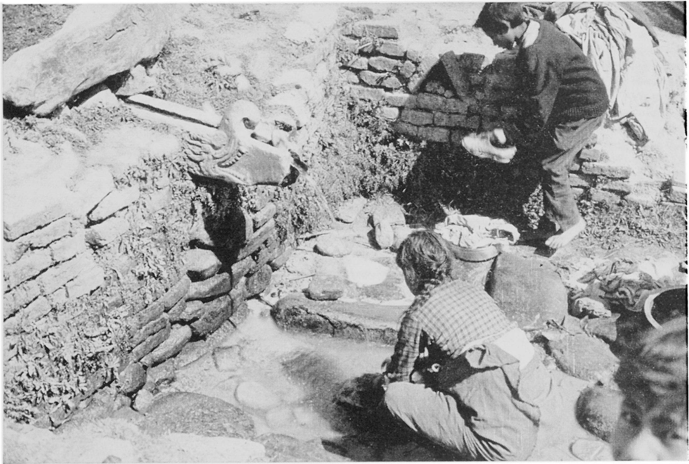
Abbildung 2. Quellfassung . Es handelt sich um eine kleinere Anlage östlich von Thecho (südlich des Kartenrandes), jedoch genau an der im Text beschriebenen Kontaktfläche von Mergeln und Schottern. Außer dem schön behauenen Wasserspeier beachte man auch die flachen Steine im «Trog», auf welchen die Wäsche durch Aufklatschen gereinigt wird. Töpfe zum Wegtragen von Verbrauchswasser. März 1971

Einfach ist die Frage nach dem Stauhohizont zu beantworten. Als solcher kommt nur die Auflageungsfläche der Schotter auf die Mergel in Frage. Die einzige und auf den ersten Blick erstaunlichste Ausnahme bildet die am nördlichen Stadtrand von Patan vorhandene Folge von drei benachbarten Brunnen. Den obersten findet man genau an der zu erwartenden Stelle, nämlich auf der Höhe der erwähnten Grenzfläche. Dann folgen jedoch in tieferer Lage noch zwei kräftig fließende Brunnen. Eine erste Vermutung, daß möglicherweise das überfließende Wasser von einem Brunnen zum andern geleitet werde, kann leicht durch die Sauberkeit des Wassers und die sichtbar vorhandenen Abflußrin-