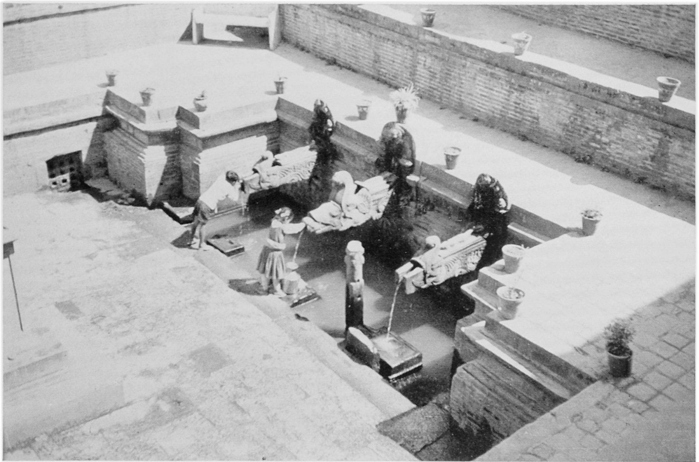
Abbildung 3. Brunnenhof . Der südlich vom Zentralplatz in Patan gelegene Brunnenhof vermittelt einen Eindruck von der Großzügigkeit dieser Anlagen. Drei mächtige aus einem einzigen Stein gehauene Wasserspeier. Aufnahme HB März 1971

nen ausgeschaltet werden. Eine gründliche Untersuchung des völlig überbauten Gebietes – erst der letzte Brunnen liegt nahe der Feldflur – macht es wahrscheinlicher, daß in einer mit Geröllen angefüllten Erosionsrinne Wasser aus der Höhe in das tiefere Niveau gelangt.