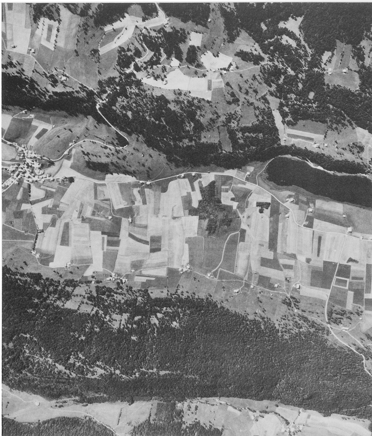
La Brévine im Neuenburger Jura (links) und Lac de Taillères (rechts). Man beachte die beidseits dem Talrand entlang gereihten Einzelhöfe mit ihrer Waldhufenflur.