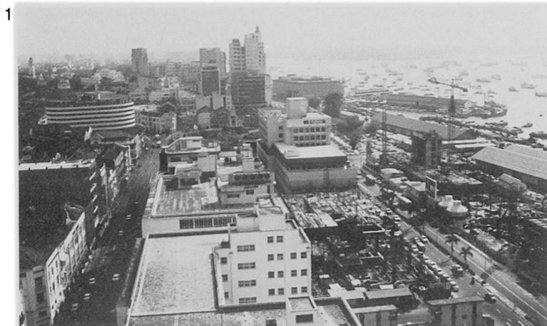
Abb. 6 Zweckmäßigkeit wird ergänzt durch ansprechende architektonische Gestaltung (Verwaltungsgebäude der Singapore Airlines).