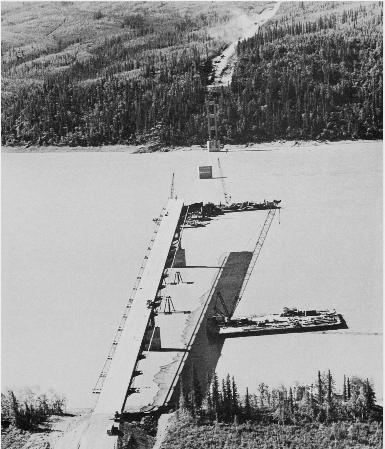
Abb: 2: Staat und Alyeska Pipeline Service Company teilten sich in die Kosten dieser 1975 fertiggestellten Brücke über den Yukon River, welche einmal auch die Pipeline tragen wird. Wir blicken in südlicher Richtung in noch unbesiedelte Waldgebiete. Bisher existierten nur temporäre Brücken im Gebiete des Yukon River.