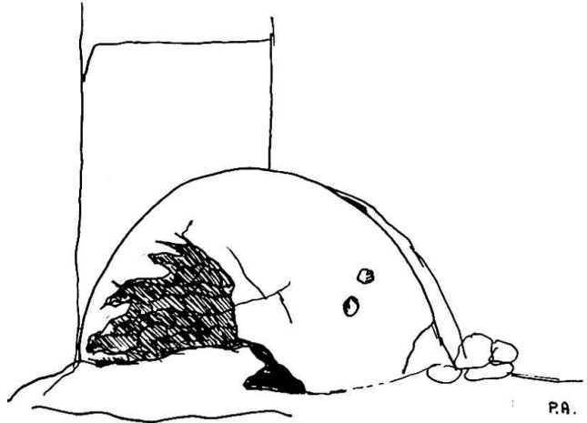
Fig. 3: Freistehender Backofen im Ortsteil Piscità, zerfallend. Diese ursprünglichen Typen wurden wohl wegen der Brandgefahr vom Haus entfernt erstellt (nach Famularo).

Fig. 2: Haus am Strand von Ficogrande (neben Hotel Sirenetta). Zur Zeit unbewohnt, relativ schlechter Bauzustand. 2 Räume im Untergeschoß, 2 im Obergeschoß. 2 Backöfen. «Bauern-Fischer-Haus».