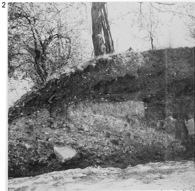
Abb. 2 Osterfingen. Angeschnittenes ebenerdiges sogenanntes «Großhaus» mit zwei Pfostenlöchern (für starke Pfosten). Karolingerzeitlich.