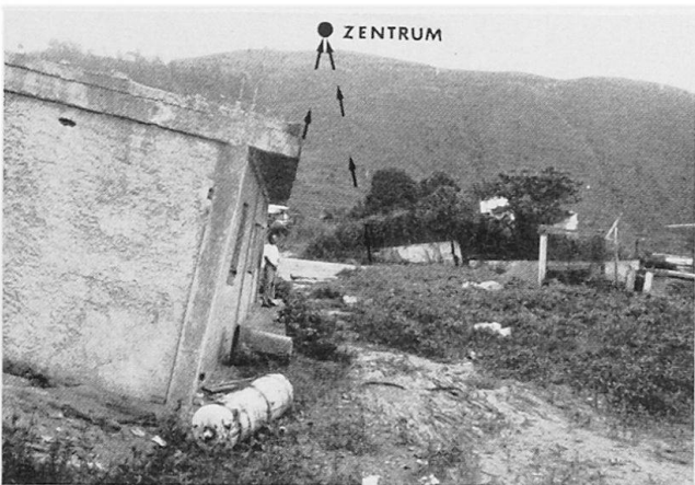
Bild 3 Rotationsförmige Sackung und Wirkung auf Bauten (bei Caracas, Venezuela).