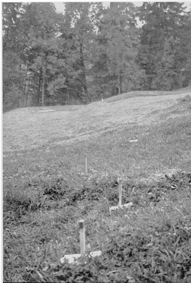
Bild 1 Nachkontrolle einer Vermarkung nach einiger Zeit: Die Pfähle waren ursprünglich in einer Geraden.

Abholzen beschleunigt. Verbauungen am Fuss eines Hanges verhindern die seitliche Untergrabung von Hängen durch Bergbäche. Die mögliche Instabilisierung von Hängen durch Stauseen an deren Fuss kann abgeschätzt werden. Drainage kann dem durch Regenfälle erzeugten Porenwasserdruck entgegenwirken. Schliesslich können Prognosen für katastrophale Ereignisse, wie Murgänge und Bergstürze gemacht werden: Durch eine rechtzeitige Warnung kann, wenn das Ereignis auch nicht zu verhindern ist, doch das Leben der Bevölkerung geschützt werden.