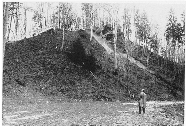
Bild 4 Durch Forststraße induzierter Berggrutsch (am Üetliberg-Kulm bei Zürich).