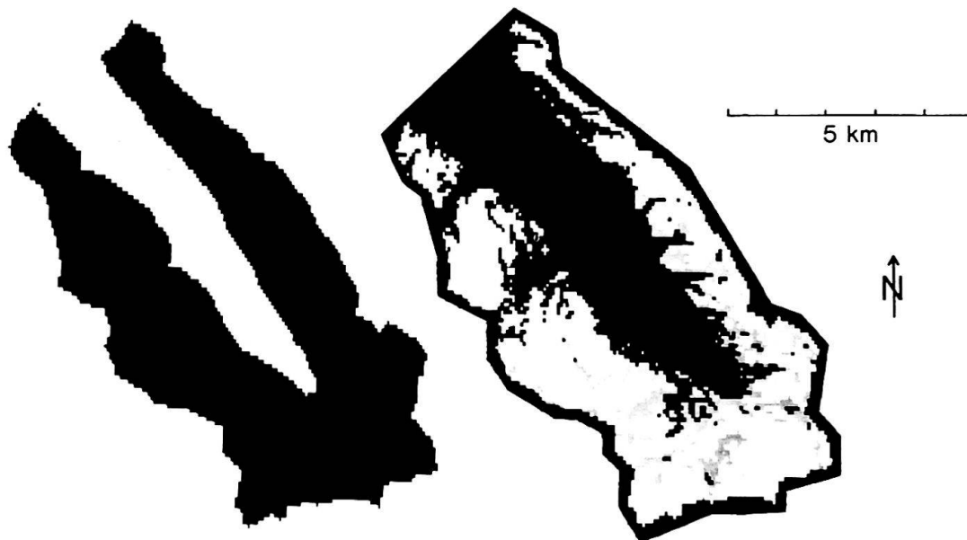
Fig.3: Automatisierte Schneedecken-Klassifikation u. Berechnung der Flächenanteile in verschiedenen Höhenstufen — Hinteres Dismatal, Davos (aus URFER, 11).