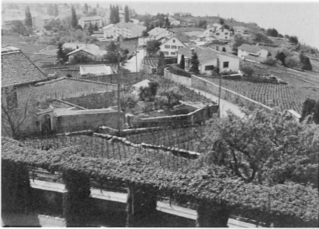
Phase récente d'urbanisation du vignoble de Lavaux entre Cully et Grandvaux.