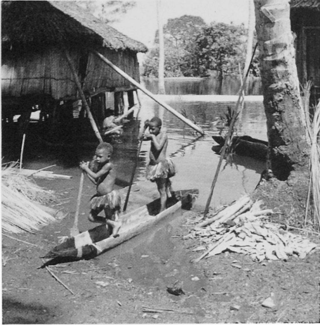
Abb. 1: Zwei Mädchen aus dem Dorfe Aibom im südlichen Hinterland des Mittelsepik (Papua New Guinea) in ihrem neu angefertigten bemalten Einbaum. Der sonst trockene Dorf-boden ist vom regenzeitlichen Hochwasser weithin überschwemmt. Der traditionelle Frauenschurz wird heute nur noch zu festlichen Anlässen getragen.