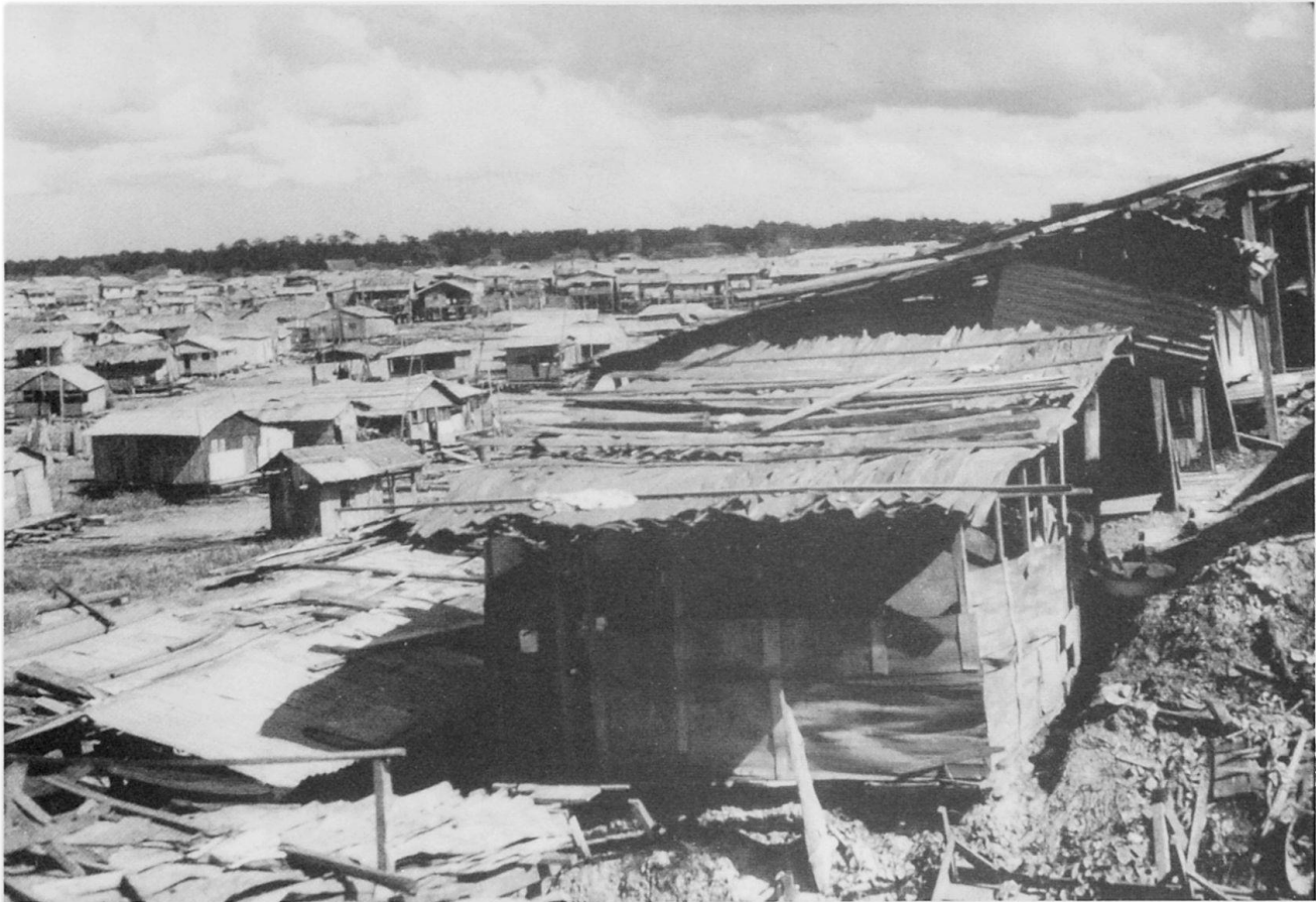
Abb. 4: «Da die Bevölkerung Pucallpas sehr rasch wächst, ist die Stadt schon längst über die auf dem Stadtplan verzeichneten Grenzen hinausgewachsen. Deshalb gibt es rund um die Stadt herum eine wilde, spontane Besiedlung durch Mestizen und Indios. Solche Siedlungen ohne Trinkwasseranschluß, ohne Kanalisation und Elektrizität werden «pueblos juvenes» (Slums) genannt. Der Bevölkerungsdruck ist offenbar so groß, daß es sogar im Hafenbecken von Pucallpa, das während der Trockenzeit fast ausgetrocknet ist, zur wilden, spontanen Besiedlung kommt.»

Oriente. Und so ging es also darum, die «Carretera Central», wie diese Pionierstraße genannt wird, um etwa 300 km bis nach Pucallpa zu verlängern. Mit dem Bau der Straße wurde 1933 begonnen. Sie erreichte 1936 Tingo Maria (ebenfalls ein wichtiges Pionierzentrum) und, nach Überwindung verschiedener Schwierigkeiten, 1942 Pucallpa am Ucayali. Offiziell wurde die Straße am 8. September 1943 dem Verkehr übergeben. Pucallpa war damit über eine Strecke von 843 km mit Lima an der Pazifikküste verbunden.