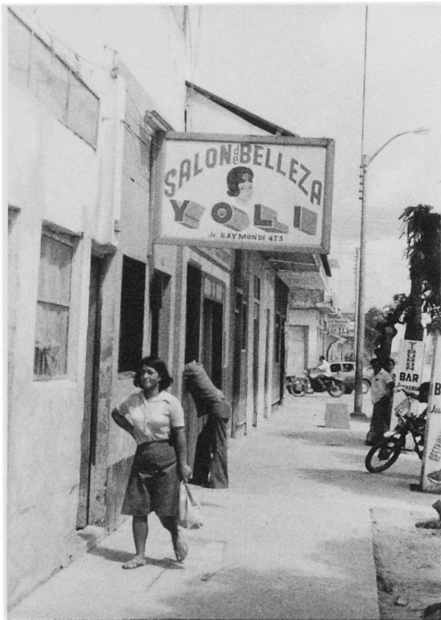
Abb. 2 Ist dieser Wunsch der Weiblichkeit, sich schön zu machen, in dieser aus Staub geborenen Stadt mitten im Amazonasdschungel, nicht erst recht legitim?

und nicht nach irgendwelchen Normen einrichtet. Wohn- und Geschäftsgebäude wechseln sich ab, dazwischen Häuser, in denen beide Funktionen untergebracht sind.