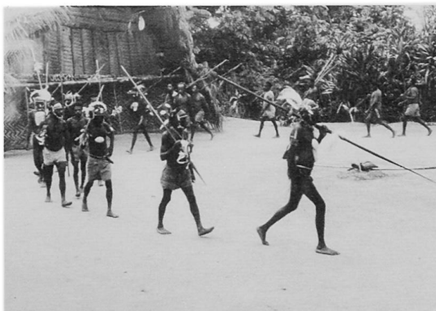
Abb. 2 Kultplatz in Mamsi (Bongos-Gebiet, Kwanga); Jäger tanzen um ein getötetes Tier (Wallaby), links im Hintergrund die Fassade des Kulthauses.

Zeremonien wieder verfällt. Auch andere Objekte, die mit dem Kult zusammenhängen, werden nicht für eine Dauer, als permanente äußere Erscheinung einer jenseitigen Wesenheit, angelegt. Das ist der Grund, warum man in Kwanga-Dörfern meistens keine kwaramba -Kulthäuser antrifft. Der Tanzplatz ( kondome ) wird während des Kultes zeitweise durch einen zusätzlichen Zaun abgegrenzt. Vor den Festen wird sämtliches Gras auf dem Platz entfernt. Die Sitzplätze für die Männer befinden sich auf den Seiten des Platzes.