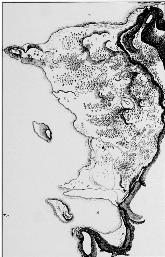
Fig.1 Carte de l'île d'après l'édition originale publiée à Zurich en 1813.