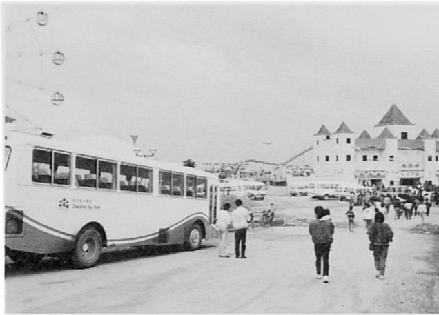
Abb.3 Recreational Centre Xili Reservoir

täglich bis 10'000 Besucher "bewältigen" können. Der architektonische Habitus der Erholungszentren von Shenzhen ist teilweise an amerikanischen Vorbildern orientiert (Abb. 3); die Bauten weisen bereits heute starke Abnutzungserscheinungen auf.