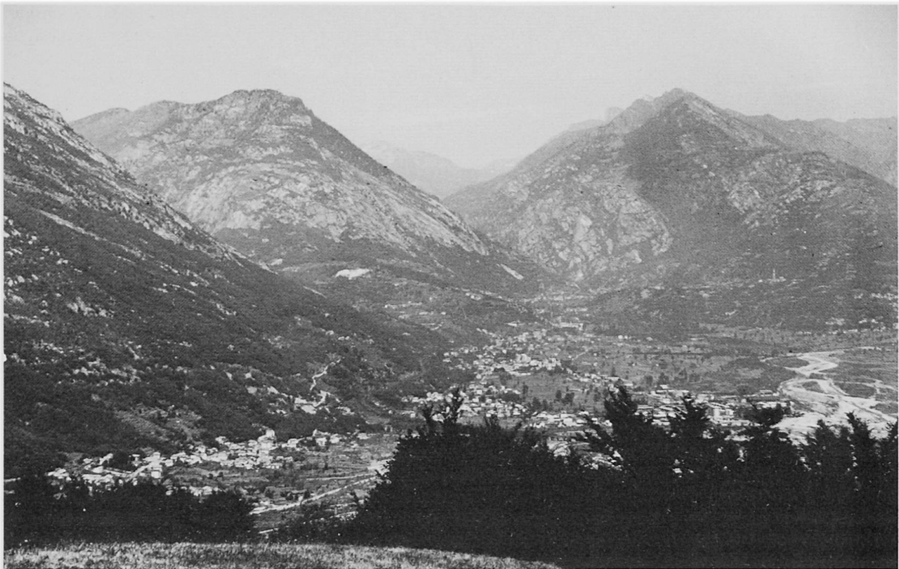
Fig. 1 Die Toce-Ebene bei Domodossola mit den 4 Talmündungen: der Valle di Bognanco (im Vordergrund links), der Val Divetro (links) mit dem eisüberschliffenen Felsvorbau von Enso hinter Preglia an der Mündung, dahinter der bis zum Grat überprägte Colmine di Crevola, di Valle Antigorio (Bildmitte), die überschliffenen Felsvorbauten von Montecrestese, dahinter der fast bis zum Gipfel überprägte Monte Larone und die Valle dell'Isorno (rechts).