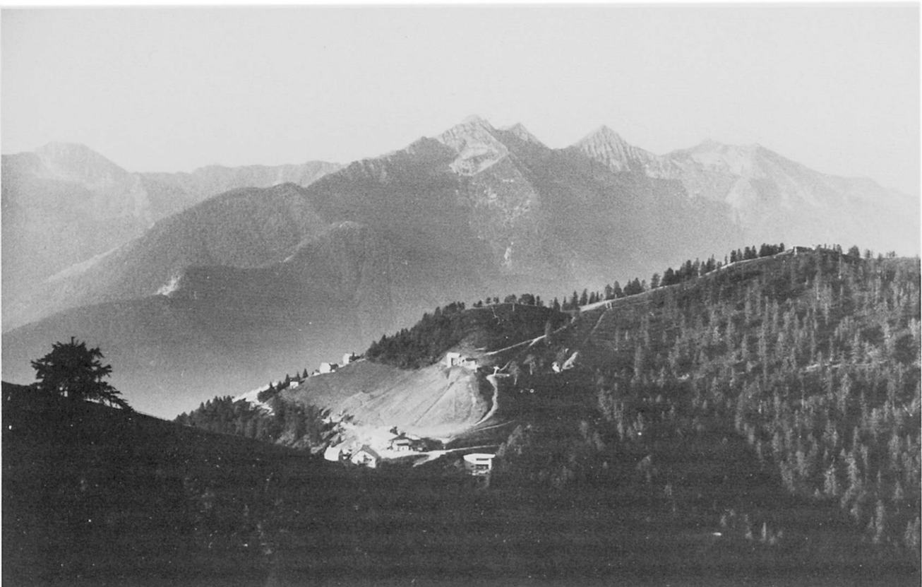
Fig. 5 Piano di Vigezzo mit der von rißzeitlichem Eis überprägten Cima N von S. Maria Maggiore, dahinter die Längstalfurche der Val Vigezzo mit den eisüberprägten Gipfeln im Mittelgrund, dem Pizzo dei Diosi (links), die Bocchetta di Vald, der Grat zum P. Nona, der Pyramide des P. Togano und die gegen Domodossola abfallende Kette.