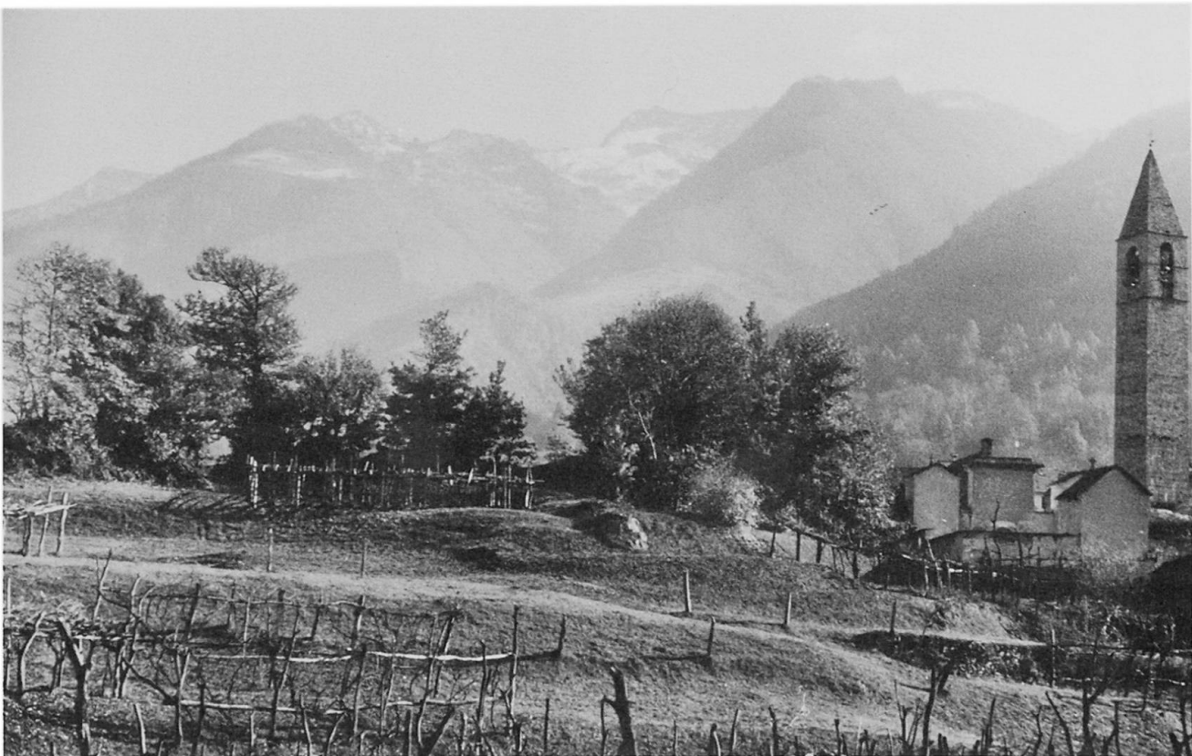
Fig. 2 Der rundhöckerartig überprägte Eingang der Val Vigezzo von Trontano. Im Hintergrund der eisüberschliffene Mündungsbereich von Montecrestese–Altoggio zwischen der Valle Antigorio (links) und der V. dell'Isorno (rechts).