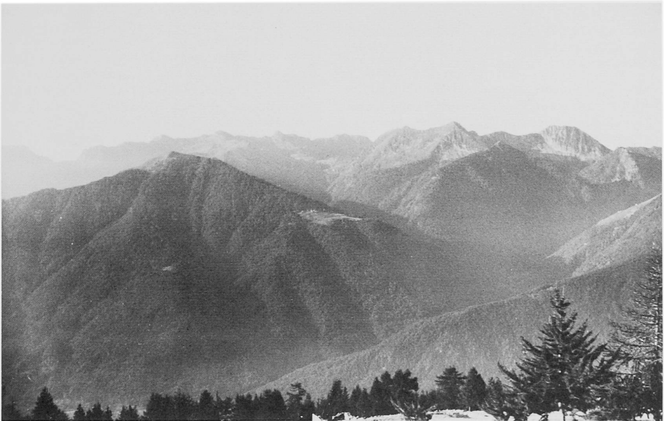
Fig. 4 Die in die Val Vigezzo mündende Valle Loana mit der Laurasca-Gruppe im Talschluß von der Colma N von Malesco aus; davor (links) die von rißzeitlichem Eis überprägte Testa del Mater, der Moncucco (rechts), dahinter P. Stagno (links) und P. dei Diosi mit der Bocchetta di Vald (rechts).