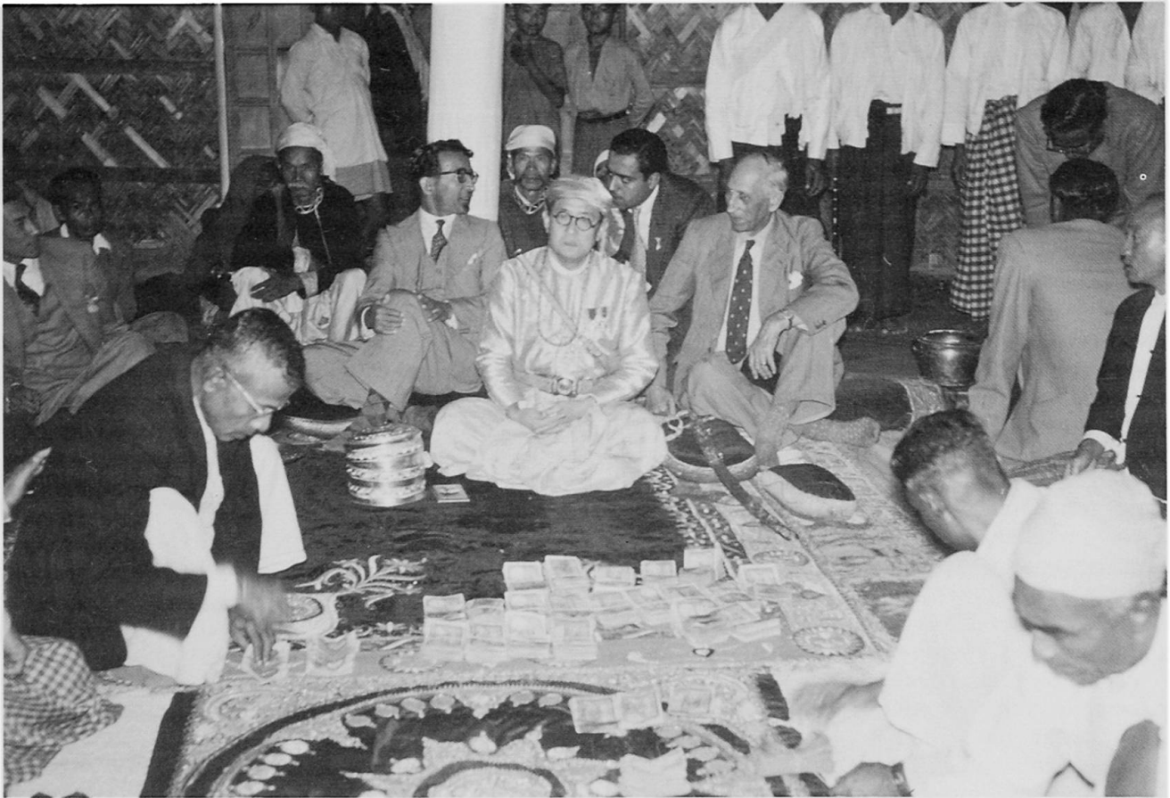
Abb. 2 Das koloniale System im Übergang (1955): Die Headmen liefern dem Chief (hier dem Bohmong-Raja) die Feldsteuern ab, der sie, nach Abzug seines Anteils, über den Deputy Commissioner (als obersten Verwaltungsbeamten der Hill Tracts, damals noch ein Engländer, zur Linken des Chiefs) an die Regierung weiterleitet (hier vertreten durch den Commissioner des Chittagong Districts, einen Bengalen, zur Rechten des Chiefs).

registrieren lassen, und jeder, der außerhalb seiner Mouza ein Feld anlegte, hatte fortan nochmal die halbe jhum tax zu bezahlen – eine Bestimmung, die den Landnutzungsbezug dieser Steuer nochmals verdeutlicht (vgl. MEY 1980: 130).