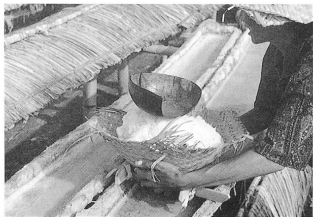
Fig. 3 Kusamba: Salzmacherin beim Ausschöpfen von auskristallisiertem Salz.

Ohne externe Unterstützung wäre es den Salzmachern und Salzmacherinnen kaum möglich gewesen, eine solche Neuerung zu erproben, da sie das Risiko eines Fehlschlags nicht eingehen können. Aus diesem Grunde kommen auch geringsten Nebeneinkünften aus Hausgärten, Feldern, Fischfang, Viehzucht, Kleinhandel usw. große Bedeutung für die Einkommenssicherung einer Familie zu. Die Produktion von Salz stellt trotz tiefer und