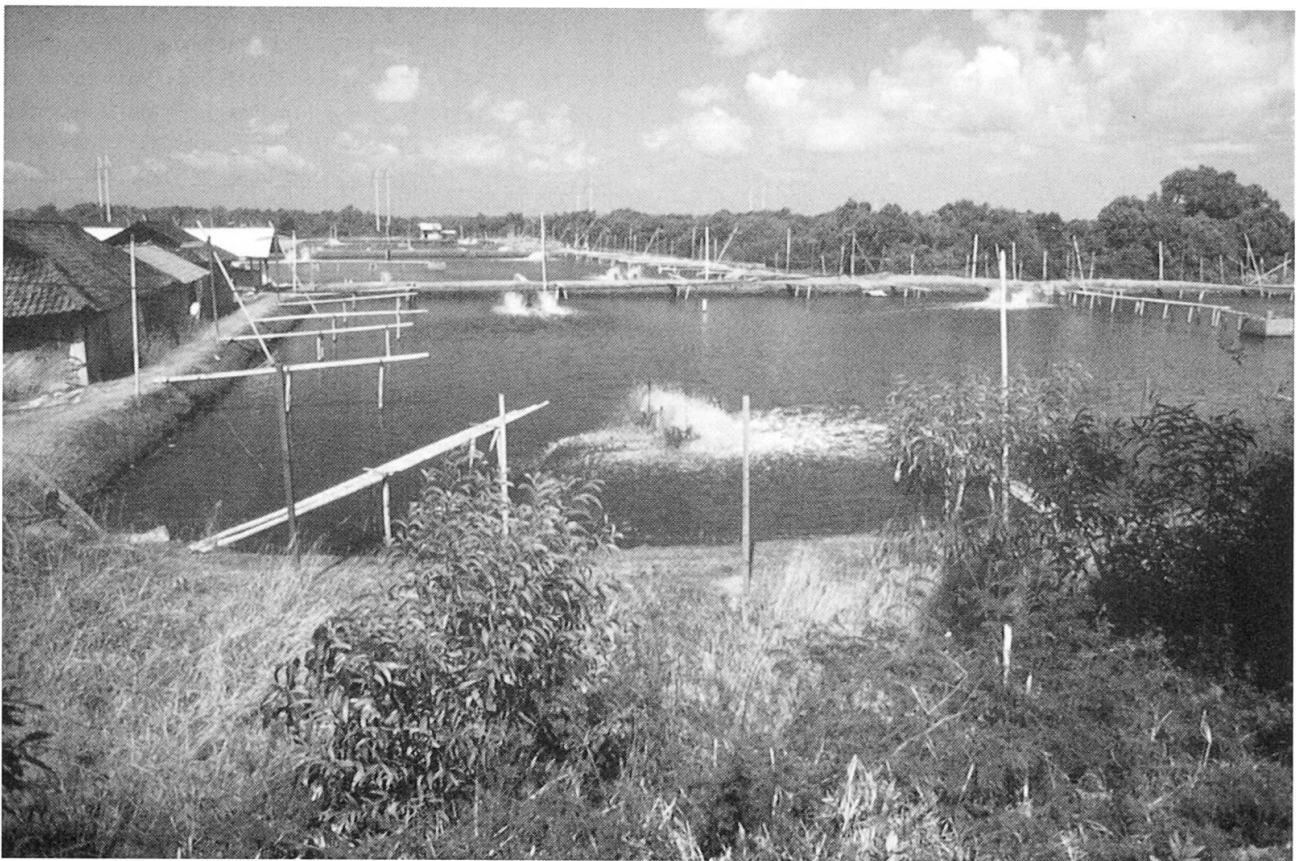
Fig. 4 Garnelenzucht südlich der Provinzhauptstadt Denpasar.

Ein Arbeiter, wie der aus Java zugezogene Soradi, betreut in der Regel einen großen Zuchtteich. Zur regelmäßigen Fütterung muß er rund um die Uhr anwesend sein. Sein Arbeitgeber, der Betreiber 7 von einem halben Dutzend Teichen (er gehört damit eher zu den kleineren Unternehmern) stellt ihm eine Schlafstatt in einer Hütte sowie täglich zwei bis drei einfache Mahlzeiten zur Verfügung. Neben Soradi werden noch fünf weitere Arbeiter 8 in den Teichen beschäftigt. Dazu kommen ein Wächter und ein