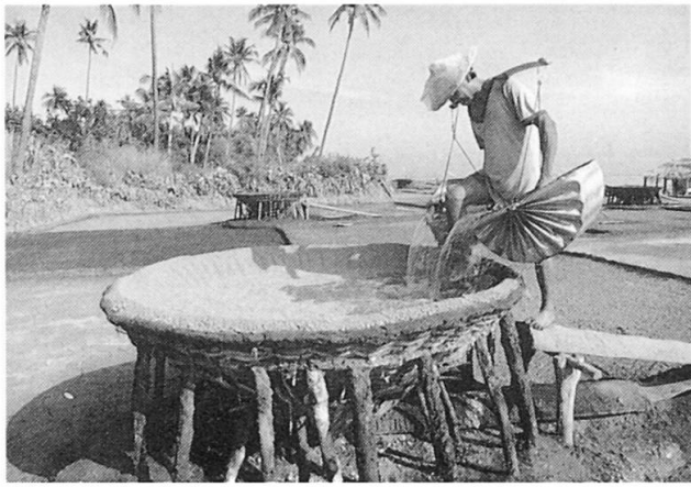
Fig. 2 Tianyar: Salzmacher beim Ausbringen von Meerwasser auf salzhaltige Erde im Trichter.

neu verteilt und trockene zusammengekehrt werden müssen. Die Felder werden in einem Turnus genutzt, der es erlaubt, jeden Tag den Filter einmal zu füllen und durchlaufen zu lassen. Diese Arbeiten dauern bis in den späten Morgen hinein. Dann wird es derart heiß, daß körperliche Anstrengungen an der prallen Sonne zur Tortur würden. Erst am Nachmittag, wenn schon ein Gutteil des Salzes auskristallisiert ist, wird in den Salzgärten weitergearbeitet.