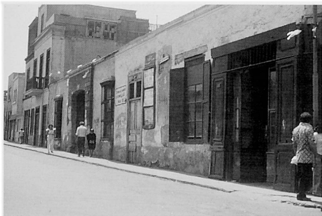
Abb. 2 Tugurios im Zentrum Limas in den 80er Jahren. Die Bauten stammen aus den 30er Jahren. Der Verputz blättert ab, das Innere verfügt nur über einen einzigen Wasserhahn für über 50 Personen (siehe Karte im Atlas S.148).

Nicht zu vergessen sind auch die Einwirkung von Feuersbrünsten oder die Schäden bei Wirbelstürmen. Die Superleichtbauweise der Squatters führt dazu, daß sie wie Zunder abbrennen oder bei Sturm wie Kartenhäuser zusammenfallen. Trotzdem besteht weltweit eine zunehmende Tendenz der Anzahl, der Gesamtfläche und der Einwohnerzahl der Squatters.