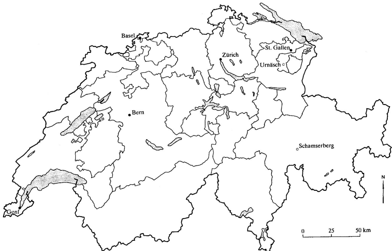
Abb. 1: Urnäsch und Schamsberg – Fallstudien aus dem Schweizer Berggebiet Urnäsch and Schamsberg – Case studies from Swiss mountain areas Urnäsch et Schamsberg – Etudes de cas dans les régions de montagne suisses Quelle: MÜHLINGHAUS 2002: 38; Kartographie: V. SCHEURING

chung einbezogen, welche es erlaubten die theoretischen Konzepte zu vertiefen und zu differenzieren (GLASER & STRAUSS 1998: 53-83). Die Auswertung der Interviews erfolgte in einer computerunterstützten qualitativen Inhaltsanalyse (MAYRING 2000), welche eine detaillierte Auswertung der Daten ermöglicht hat.